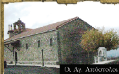
Οι Αγ. Απόστολοι