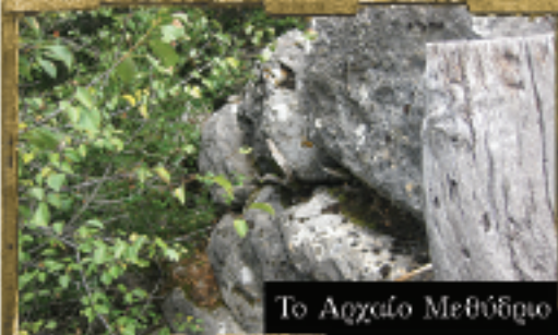
Το Αγζαίο Μεθύδιο