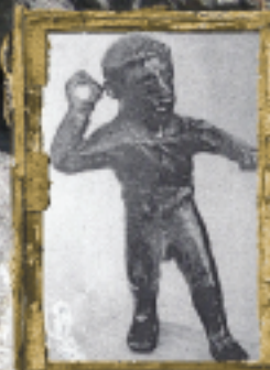
Οπλόσμιος Ζεύς (εθνικό Αρχαιολογικό Μουσείο)

Η αρχαιότερη πόλη της περιοχής. Ιδρύθηκε από τον Ορχομένο γιο του Λυκάονα γύρω στα 1600 π.χ. Η ακμή της ανάγεται κάπου τον ὄγδοο ἢ ἔνατο αἰώνα προ Χριστοῦ και επιβεβαιώνεται από τους πολλούς αρχαίους ναούς και τους αναδειχθέντες Ολυμπιονίκες. Μετά την ίδρυση της Μεγαλόπολης «συναπετέλεσε μετά άλλων κωμών Μαιναλίων και Παρρασίων τον συνοικισμόν αυτής». Ο Στράβων το 26 μ. Χ περιγράφει την παρακμή της, ενώ ο περιηγητής Παυσανίας το 174 μ. Χ βρίσκει ελάχιστους ανθρώπους να κατοικούν την περιοχή. Ο σπουδαῖος Βυτιναῖος Παπαζαφειρόπουλος στη «Μεθυδριάδα» λέει ότι η περιοχή κατοικεῖτο κατά το μεσαίωνα.