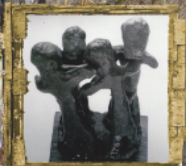
Ορχούμενες γυναίκες (εθνικό Αρχαιολογικό Μουσείο)