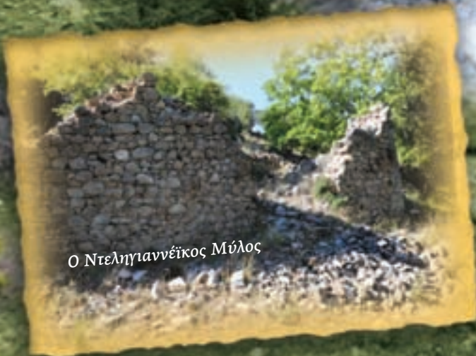
Ο Ντεληγιαννέϊκος Μύλος