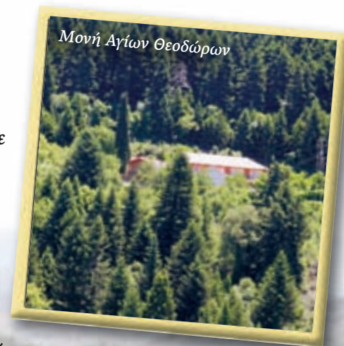
Μονή Αγίων Θεοδώρων

«ΒΥΤΙΝΑΙΟΙ ΚΑΙ ΦΙΛΟΙ ΤΗΣ ΒΥΤΙΝΑΣ, ΓΝΩΡΙΣΤΕ ΤΟ ΦΑΡΑΓΓΙ ΤΟΥ ΜΥΛΑΟΝΤΑ ΑΠΟ ΚΟΝΤΑ, ΠΕΡΠΑΤΗΣΤΕ ΤΟ, ΑΓΑΠΗΣΤΕ ΤΟ ΚΑΙ ΦΡΟΝΤΙΣΤΕ ΤΟ»