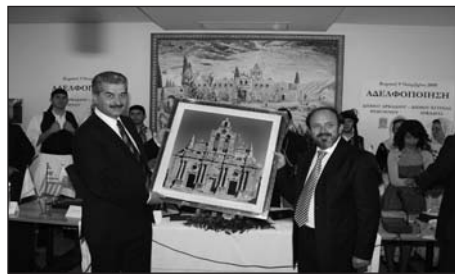
Οι Δήμαρχοι Βυτίνας και Αρκαδίου αναλλάσσοντας δώρα.

Τον αντρεωμένο μην τον κλαις Όσο κι αν αστοχήσει Κι αν αστοχήσει μια και δυο Πάλι αντρεωμένος θάναι.