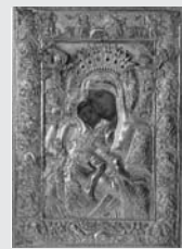
Παναγία «η εσφαγμένη»