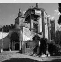
Η Μονή Βατοπαιδίου

Η μονή Βατοπαιδίου και οι άλλες δεκαεννέα μονές έφτασαν σε μας αλώβητες, εμπνέουσες το σεβασμό και δημιουργούσες την αναγνώριση για την τεράστια προσφορά τους. Η Ελλάδα χρωστάει πολλά στο χώρο αυτό και στηρίζει εκεί αρκετά από την πνευματική της ιστορία. Είναι ανήκουστο και απαράδεκτο μια ομάδα μοναχών να ξεφεύγει από το γενικό κανόνα του Ελληνισμού και του μοναχισμού και να διασύρουν την χιλιετή ιστορία του. Είναι ανήκουστο και απαράδεκτο