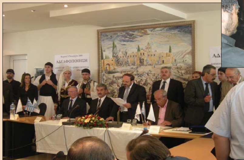
Μέλος του χορευτικού του πολιτιστικού συλλόγου Βυτίνας «κερνάει» τους Κρητικούς συναδέλφους του

Η προσφώνηση του Δημάρχου Αρκαδίου κ. Μανώλη Μανωλακάκη