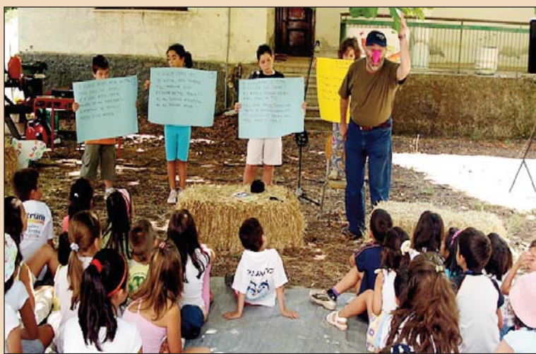
Παραμύθια για μικρούς και μεγάλους