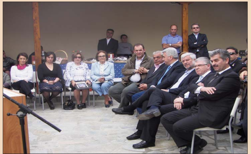
Η δωρήτρια εν μέσω της ομήγυρης των επισήμων