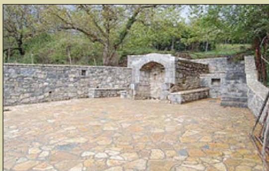
Το ανακαινισμένο από το σύνδεσμο «Κακούτσι»

Ο σύνδεσμος φιλοπροόδων: Παραγωγική θεωρείται η δραστηριότητα του συνδέσμου τη χρονιά που πέρασε. Ολοκλη-