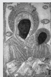
Το «Άξιον Εστί»