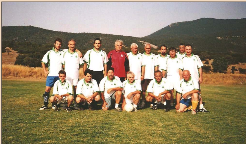
Οι παλαιμάχοι με κοιλίτσες και άσπρα μαλλιά