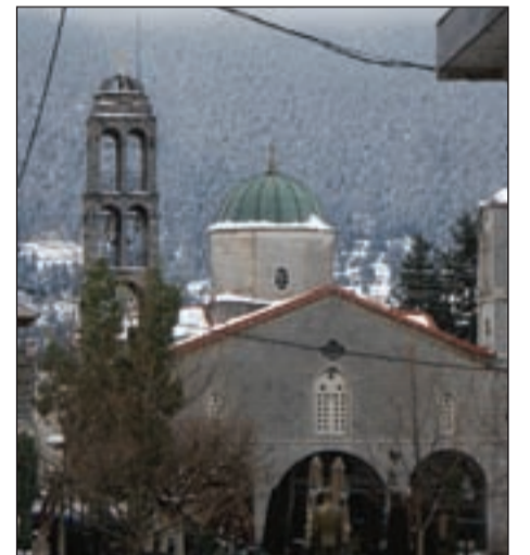
Η «κανονική» χειμωνιάτικη εικόνα της Βυτίνας

✓ Καθισμένοι στο καφενείο τούτες τις χιονισμένες μέρες με τσάι και κονιάκ θυμόμαστε με τον καλό φίλο της στήλης τους παλιούς χειμώνας της Βυτίνας, τις δυσκολίες συνθήκες επιβίωσης, τη μοναξιά του χειμώνα, τους τότε ανθρώπους, που πάλευαν μέσα από τις αντίξοες καιριές καταστάσεις. Τότε που ο χειμώνας κράταγε μέρες και ο Βυτινιώτης μόνος του άνοιγε το δρόμο με το φτυάρι, ενώ σήμερα έγινε αξιοθέατο. «Το χιόνι «πουλάει», μου λέει ο φίλος, το χαίρονται όλοι. Πολλοί το εκμεταλλεύονται εμπορικά και με το παραμικρό κλείνουν σχολεία ή κινητοποιούνται μηχανήματα. Εμείς τη δεκαετία του πενήντα κάναμε μια βδομάδα κλεισμένοι» Είναι ευχάριστος και απολαυστικός ο Βυτινιώτικος χειμώνας σήμερα. Μόνο που μέيناμε λίγο να τον απολαμβάνουμε. Τουλάχιστον τις καθημερινές. Πρέπει όμως στο σημείο αυτό να τονίσουμε τη αξιέπαινη προσπάθεια του Δήμου να επέμβει άμεσα, όπου χρειάστηκε, και να καθαρίσει τους δρόμους αλλά και να διευκολύνει την κίνηση, όχι μόνο μέσα στη Βυτίνα αλλά και στα γύρω χωριά.