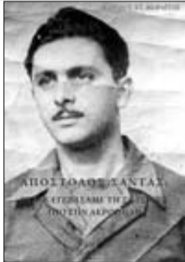
Το εξώφυλλο του υπό έκδοση βιβλίου

είχαν έρθει, χωρίς να γίνουν αντιληπτοί από κανέναν. Νεανική επιπολιότητα; Τρέλλα; Αγανακτηση για όσα έβλεπαν να διαδραματίζονται καθημερινά γύρω τους; Σίγουρα όλα αυτά μαζί, μα και κάτι άλλο βαθέτερο! Ένωσαν βαθεία την ανάγκη μέσα τους να κάνουν κάτι, που θα σήγωνε ψηλά του Έθνους τη ψυχή, όπως είχαν πράξει στο παρελθόν πολλοί του 21 ήρωες οπλαρχηγοί.