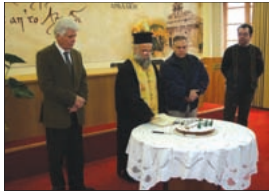
Η κοπή της πίτας του συνδέσμου.