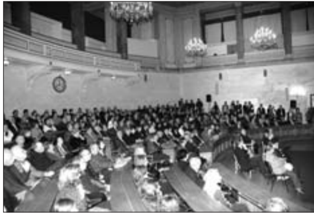
Η κατάμεστη αίθουσα της Παλιάς Βουλής

έτσι ο φόβος της αποτυχίας γινόταν πιο έντονος. Όμως στη συγκεκριμένη περίπτωση λειτούργησε εκείνο το υπολανθάνον πατριωτικό συναίσθημα του Βυτιναίου, που στις κατάλληλες στιγμές ξυπνάει και τον κάνει να εκδηλώνει με πάθος την αγάπη για τον τόπο του.