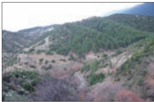
Τα «βεδούγια» με τις παλαιές αναδασώσεις

Ο Περιβαλλοντικός Σύνδεσμος Μαινάλου δραστηριοποιείται σχετικά με τα προβλήματα, που υπάρχουν στην ευρύτερη περιοχή του Μαινάλου και τις ανάγκες αναδάσωσης, αλλά και προστασίας της χλωρίδας και της πανίδας. Μέσα στα πλαίσια των δραστηριοτήτων αυτών οργάνωσε αναδάσωση στη περιοχή του βιολογικού καθαρισμού και συγκεκριμένα στην τοποθεσία «Βεδούχια» με δενδρύλλια Μαύρης Πεύκης ( pinus nigra) την Κυριακή 28-2. Για τους παλαιότερους, που δεν θυμούνται και για τους νεότερους που δεν γνωρίζουν όλη η περιοχή αυτή είχε αναδασωθεί τεχνητά στις αρχές της δεκαετίας του πενήντα με πρωτοβουλία του Δασαρχείου Βυτίνας και συμμετοχή του τότε εξαταξίου Γυμνασίου Βυτίνας αλλά και πολλών Βυτιναίων. Τέτοιες πρωτοβουλίες όπως αυτή του περιβαλλοντικού συνδέσμου είναι εξαιρετικά αξιότιμες, βοηθούν αποφασιστικά στην ανάπλαση του τόσο ταλαιπωρημένου περιβάλλοντος και μας βρίσκουν στο πλευρό του συνδέσμου.