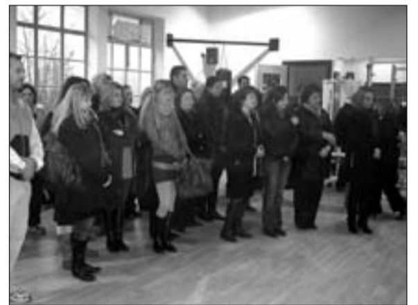
Από την τελετή των εγκαινίων της κλειστής αίθουσας γυμναστικής