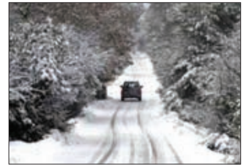
Χιονισμένο Βυτινιώτικο τοπίο όπως προβάλλεται από το «Αρκαδία bloks»

1 με απόφαση του Νομάρχη Αρκαδίας διεκόπησαν τα μαθήματα στα σχολεία της Βυτίνας.