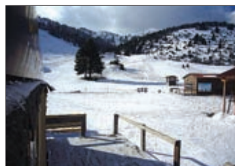
Το χιονοδρομικό του Μαινάλου την Παρασκευή το μεσημέρι 22-1-2010

✓ 22 Γενάρη. Μας επισκέφτηκαν τα πρώτα χιόνια πραγματικά. Κάπως καθυστερημένα αλλά η Βυτίνα ξημέρωσε κάτασπρη. Για πρώτη φορά εφέτος απαιτούνται αντιολισθητικές αλυσίδες στο δρόμο Τρίπολη- Ολυμπία. Άσπρισε όλος ο τόπος και τα καλοριφέρ καίνε στο φουλ. Το Σαββατοκύριακο είχαμε μεγάλη κίνηση. Οι πρώτοι επισκέπτες άρχισαν να φτάνουν από την Παρασκευή το βράδυ, για να χαρούν τη χιονόπτωση Το χιονοδρομικό του Μαινάλου έτοιμο να δεχθεί επισκέπτες με αρκετό χιόνι. Οι δρόμοι και από τις δύο πλευρές ανοικτοί.