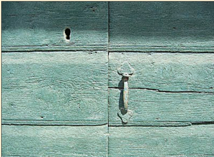
Ανάθεμα που αγάπησα το χώμα σου πατρίδα, Και διπλοτρισανάθεμα που δε σε ματαΐδα.

Αγίου Τρύφωνα, αφού και εκεί είναι ο ίδιος πολιούχος. «Πέρασε άλλος ένας χρόνος, όχι τόσο παραγωγικός, ούτε με τον ίδιο ενθουσιασμό όσο ο πρώτος. Οι υποχρεώσεις πολλές, η εργασία «στύβει» τον εγκέφαλο και δεν αφήνει πολύ χρόνο για σκέψη και δημιουργία. Το χωριό επίσης δεν έδωσε ιδιαίτερες αφορμές για έμπνευση, βυθισμένο κι αυτό στη μιζέρια της καθημερινότητας και της έλλειψης οραμάτων. Ωστόσο τα διαδικτυακά Βυτιναίικα συνεχίζουν το ταξίδι τους, σταγόνα μέσα στον ωκεανό της «Μπλογκόσφαιρας». Καλή συνέχεια τον τρίτο χρόνο του ταξιδιού!»