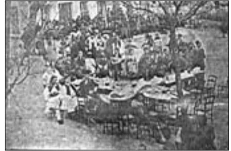
Καθαρά Δευτέρα στη Βυτίνα το 1925

Παρασκευή έως Δευτέρα». Εμείς οι ντόπιοι περάσαμε ευχάριστα μέσα στην πολυκοσμία. Τζάκι, μπριζόλες, δίπλες και κανένα αποκριάτικο τραγούδι. Οι παλιές «μπούλες» χάθηκαν στο βωμό της εξέλιξης. Απλώς τις βλέπουμε στα εμπορευματοποιημένα καρναβάλια των μεγαλουπόλεων. Καθαρή Δευτέρα και «κούλουμα». Αναμνήσεις από παλιές παρέες και έθιμα. Εκείνοι που τα πραγματοποιούσαν «έφυγαν» και οι νέοι δημιουργούν τα δικά τους έθιμα. Όλα είναι καλοδεχούμενα. Και του χρόνου!