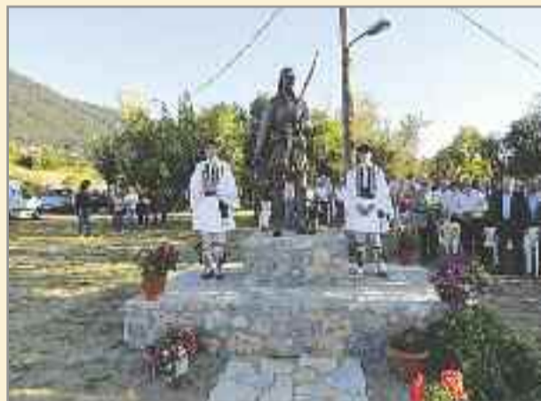
Η προτομή του Κόλλια του Βυτινιώτη στην είσοδο της Βυτίνας.