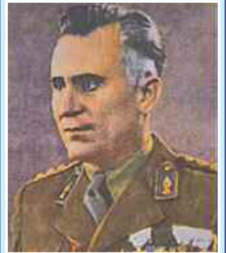
Ο Συνταγματάρχης Λαβάζης.

Χρέος των μεταγενεστέρων απέναντι στους συντελεστές μεγάλων ιστορικών γεγονότων είναι η γνώση και η μνήμη. Είναι το ελάχιστο, που μπορούν να προσφέρουν προς τους ανθρώπους εκείνους, οι οποίοι σήκωσαν το μεγάλο βάρος της ιστορικής ευθύνης και ανεδείχθησαν αντάξιοι του καθήκοντος απέναντι στην πατρίδα, αλλά και στον εαυτό τους. Διεφύλαξαν την ακεραιότητα της χώρας τους και δεν επέτρεψαν την καταρράκωση της αξιοπρέπειάς τους. Η Ελλάδα, παρόλο μικρή