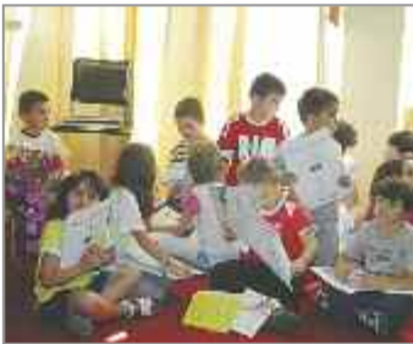
Τα μικρά Βυτινωτόπουλα διαβάζουν με ενδιαφέρον το πληροφοριακό υλικό.