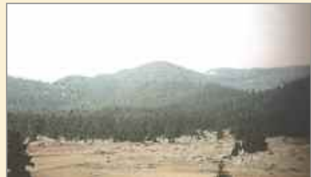
«του Κόλλια το πήδημα» στην καρδιά του Μαινάλου.

Η ημέρα αυτή είναι σημαντική για τον τόπο μας. Το χρέος των μεταγενεστέρων προς τις καταξιωμένες προσωπικότητες του τόπου τους είναι να τους θυμούνται, να τους τιμούν και να εμπνέονται από τη δράση τους και τα ιδανικά τους. Ένας τρόπος μνήμης είναι και η ανέγερση μνημείων, τα οποία υπενθυμίζουν στους μεταγενέστερους τις ιστορικές προσωπικότητες, τις πράξεις τους και τις θυσίες τους και στέλνουν το μήνυμα ότι στις δύσκολες στιγμές πρέπει ο καθένας να κάνει το χρέος του προς την πατρίδα. Η κατακλειδα του λόγου της Αθανασίας Γουρζουλίδου περιείχε όλη τη σημασία του γεγονότος. «Σεπτή μορφή ήρωα Κόλλια, η αύρα του Μαινάλου, που θα καταβαίνει