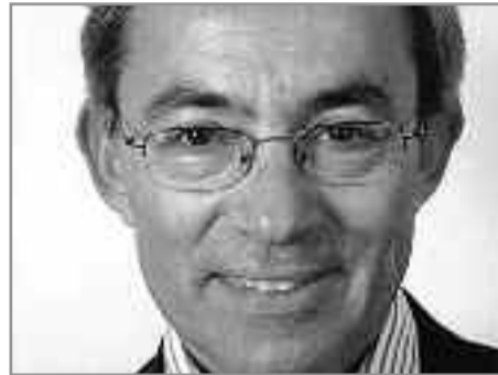
Ο Κύριος Χρήστος Πισσαρίδης ο οποίος μοιράστηκε το Νόμπελ οικονομίας με δύο Αμερικάνους

του αιώνα, που τον πρώτο λόγο στη διαμόρφωση των αντιλήψεων του έχουν τα σύγχρονα τηλεοπτικοακουστικά μέσα, τα οποία παρουσιάζουν ό,τι πουλάει και πανικοβάλλουν συνεχώς το σύγχρονο Έλληνα. Μέσα δε σε αυτό το ζοφερό περιβάλλον δεν υπάρχει χρόνος για συζήτηση, για