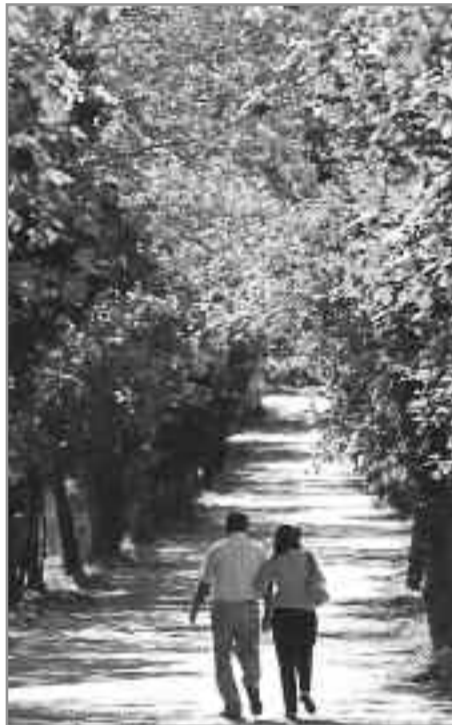
Η πιο γνωστή περιοχή της Βυτίνας, «ο δρόμος της αγάπης», που προβάλλουν όλα τα ταξιδιωτικά περιοδικά.

των Αμπελακίων του δήμου Φαλαισίας, στο μοναστήρι της Έλωνας του δήμου Λεωνιδίου και στην Αγία Θεοδόρα στον Μπάστα. Αυτές οι εκδρομές είναι ένα ευχάριστο διάλειμμα στη μονοτονία της καθημερινότητας. Συνδυάζουν τη ψυχαγωγία και τη θρησκευτικότητα δίνοντας την ευκαιρία σε πολλούς συμπατριώτες μας να επισκεφθούν μέρη πρωτόγνωρα και να εκφράσουν τα θρησκευτικά τους συναισθήματα. Τέτοιες εκδηλώσεις πρέπει να οργανώνονται σε συχνότερα διαστήματα από το δήμο, που είναι αξιέπαινες οι προσπάθειές του, εντασσόμενες στα πλαίσια των πολιτιστικών δραστηριοτήτων.