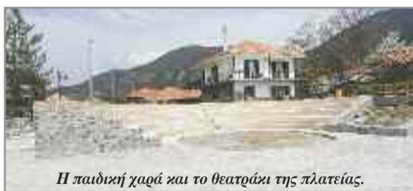
Η παιδική χαρά και το θεατράκι της πλατείας.

Σ τις 18-9 το απόγευμα και ώρα 19.00 περίπου, μετά τα αποκαλυπτήρια του αγάλματος του Κόλλια, έγιναν τα εγκαίνια της πλατείας του παπά Ανυπόμονου στα «Λαστέϊκα». Η πλατεία είναι δημιούργημα της παρούσας δημοτικής αρχής και ήλθε να υλοποιήσει ένα μακροχρόνιο αίτημα των κατοίκων του συνοικισμού σε υπάρχοντα χώρο. Στο έργο αυτό η ΒΥΤΙΝΑ είχε αναφερθεί σε παλαιότερα φύλλα της και αποτελεί κόσμημα για την περιοχή, διότι είναι σχεδιασμένη έτσι, ώστε να ικανοποιεί τις ανάγκες μικρών και μεγάλων. Η πλατεία έχει μία καλοσχεδιασμένη παιδική χαρά, ένα μικρό θεατράκι, μοναδικό για τη Βυτίνα και χώρους αναψυχής. Η πλατεία αφιερώθηκε στον παπά Ανυπόμονο (ιερομόναχο Γερμανό Δημάκο), ο οποίος συμμετείχε στην Εθνική Αντίσταση κατά των Γερμανών κατακτητών και μόνιαζε μέχρι το θάνατο του στο μοναστήρι Αγάθωνος.