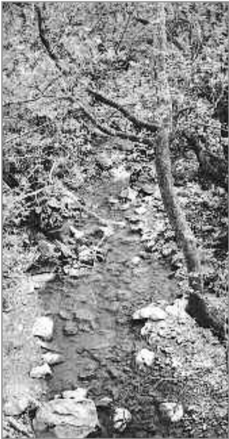
Το φαράγγι του Μυλάοντα η αξιοποίηση του οποίου μάλλον θα μείνει όνειρο.