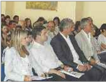
Στη πρώτη θέση των καθημένων η Υφυπουργός κ. Αποστολάκη, ο βουλευτής κ. Κωνσταντινίδης, ο δήμαρχος κ. Σακελλαρίου, ο σύμβουλος του Υπουργού κ. Παπαγεωργίου.