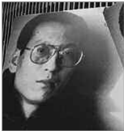
Ο Κινέζος αντικαθεστωτικός Λιού Σάο Μπό που έλαβε το Νόμπελ ειρήνης

Οι πολιτικοί επιλέγουν το δρόμο της πάλης. Όλα θυσιάζονται στο βωμό της διεκδίκησης της εξουσίας. Ό,τι λέει ο ένας το αναίρει ο άλλος και οι χαρακτηρισμοί, που ανταλλάσσονται δεν μπορούν να θεωρηθούν κόσμιοι. Οι ηγέτες όμως διαμορφώνουν πρότυπα και οι σύγχρονοι ηγέτες κάθε άλλο παρά συμβάλλουν στην καλλιέργεια θετικών προτύπων. Ουδείς αναλαμβάνει το βάρος της ευθύνης αλλά για όλα φταίνει οι προηγούμενοι δημιουργώντας έτσι στον πολίτη και ιδιαίτερα στο νέο την απογοήτευση και την αδιαφορία, παρόλο που η δημοκρατία απαιτεί τη συμμετοχή όλων στις διαδικασίες. Έτσι όλα διαμορφώνονται μέσα από τη συναλλαγή, το χρηματισμό, τους συμβιβασμούς και το «ρουσφέτι» κάτι που απομακρύνει την αρχή της αξιοκρατίας και της αξιοπρέπειας, οι οποίες είναι βασικές προϋποθέσεις για την επικράτηση αξιών και την καλλιέργεια προτύπων σε μια κοινωνία.