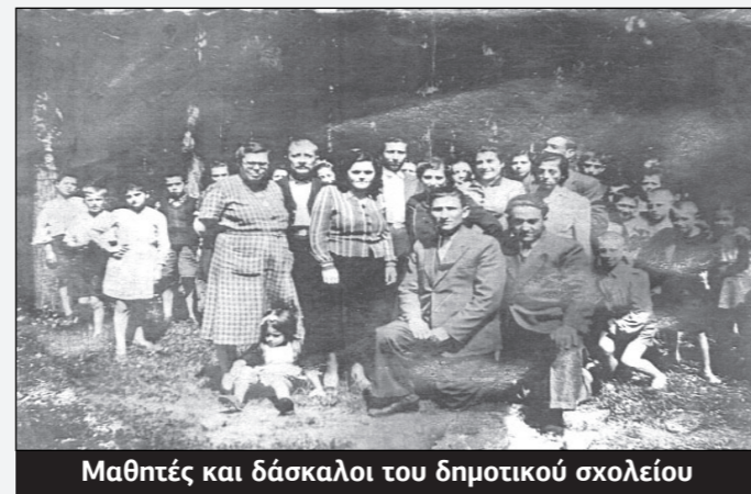
Μαθητές και δάσκαλοι του δημοτικού σχολείου