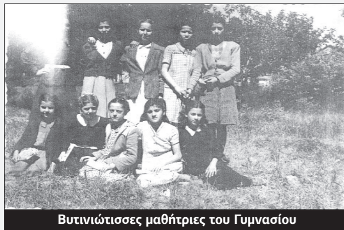
Βυτινιώτισσες μαθήτριες του Γυμνασίου