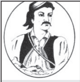
Ζαχαριάς ο Βαρβιτσιώτης

Μόνο ένας, ο καπετάνιος Ζαχαριάς Βαρβιτσιώτης με την αχαλίνωτη ερωτική επιθυμία «δεν έβανε σύνορο στις γυναίκες». Σύμφωνα με αδιάφυστες μαρτυρίες οι Βυτινιάες διεκρίνοντο για το κάλλος τους και στόλιζαν τα χαρέμια Τούρκων και οίκους αρχόντων της εποχής. Ο Ζαχαριάς αγάπησε παράφορα «σαν μαθητούδι» την Βυτινία καλλονή Αγγελική και για χάρη της διημέρευε τακτικά στη Βυτίνα.