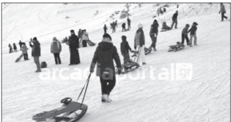
Από τις μέρες της μεγάλης επισκεψιμότητας

Το kalimera Arkadia επισκέφθηκε το χιονοδρομικό και οι υπεύθυνοι λειτουργίας του δήλωσαν τα εξής: