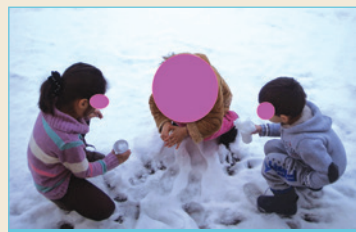
Οι μικροί μαθητές παίζοντας με το χιόνι

Το δίμηνο του Ιανουαρίου και του Φεβρουαρίου έπεσαν αρκετά χιόνια με αποτέλεσμα το νηπιαγωγείο να μη λειτουργήσει κάποιες μέρες, όπως και τα άλλα σχολεία της Βυτίνας. Μια όμως από τις χιονισμένες μέρες του Φλεβάρη, που το σχολείο λειτουργήσε δόθηκε η ευκαιρία στους μικρούς μαθητές του σχολείου να γνωρίσουν