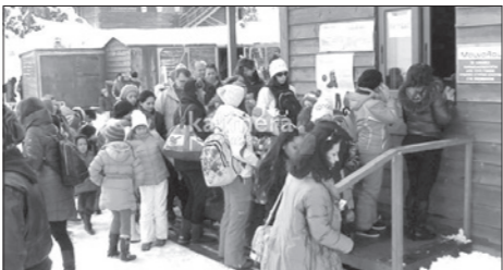
Από το party του χιονοδρομικού το Σάββατο 7-2-2014

και εκσυγχρονισμού. Τα προβλήματα επέτεινε ο περηνός ύποπτος εμπρησμός του σαλέ. Ο νέος όμως ενοικιαστής έχει οργανώσει με σύγχρονο τρόπο τις εγκαταστάσεις, ενώ έχει ανακαινίσει τις παλαιές και έχει δημιουργήσει νέες. Για τον πλήρη εκσυγχρονισμό όμως έχει εκπονήσει ένα δεκαπενταετές σχέδιο, αλλά ο διπλασιασμός των θέσεων πάρκινγκ και η πλήρης λειτουργία όλων των πιστών κατά τη διάρκεια των εορτών, όπως δήλωσαν οι υπεύθυνοι, οι επισκέπτες έφτασαν τις 20.000.