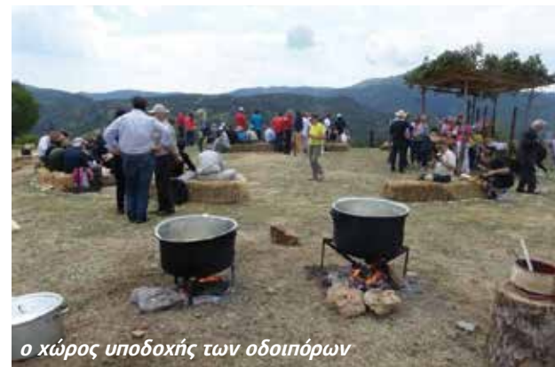
ο χώρος υποδοχής των οδοιπόρων

Εκεί τους περίμενε, εκτός από το βραστό κρέας, ντόπιο "κοκκινέλι" σε ένα βαγέτι κάτω από τη μεγάλη "γκορτσιά" που σεβριζιζόταν σε καλαίσθητα πήλινα κύπελλα με την ονομασία "Mainalon trail", ενώ όσοι ασχολούντο με την εκδήλωση φορούσαν ομοιόμορφες μπλούζες με την ίδια ονομασία. Η εκδήλωση διήρκεσε μέχρι τις πέντε το απόγευμα, διότι οι περιπατητές έπρεπε να συνεχίσουν την πορεία προς τη Νυμφασία. Την εκδήλωση επισκέφθηκαν προερχόμενοι από άλλες παρόμοιες εκδηλώσεις ο περιφερειακός σύμβουλος κ. Κοτσίρης, ο δήμαρχος κ. Γιαννόπουλος, οι αντιδήμαρχοι κ. κ. Καραντώνης και Μαρίνα Διαμαντοπούλου, η πολιτευτής Αρκαδίας κ. Τατούλη, ενώ παρέστησαν ο πρόεδρος του τοπικού συμβουλίου κ. Λιαρόπουλος, ο πρόεδρος της Παγορτυνιακής ένωσης κ. Πλέσσιας, οι πρόεδροι των Βυτινιώτικων συλλόγων "Απανταχού Βυτινίων" κ. Παπαδέλος, Φιλοπρόδων κ. Ζαχαρόπουλος, Πολιτιστικού κ. Κατσούλιας, Επαγγελματιών κ. Κουρεμένος, η εκπρόσωπος του Ομίλου Κυριών κ. Θαλασσινού, ο πρόεδρος του ΣΑΟΟ Τρίπολης κ. Δέδες, και μεγάλο πλήθος είτε οδοιπόρων, είτε επισκεπτών του Σαββατοκύριακου ντόπιων και ξένων. Επίσης επίσκεψη στη Βυτίνα έκανε ο γνωστός παρουσιαστής του καναλιού Travel Channel Τζονάθαν Πάνγκ, ο οποίος δήλωσε: "Η Αρκαδία είναι πανέμορφη, την έχω ερωτευτεί, και είμαι ενθουσιασμένος με τη θερμή φιλοξενία, το φαγητό, την ομορφιά του τοπίου και την αρχιτεκτονική κληρονομιά." και δοκίμασε τα γλυκά του ζαχαροπλαστείου ΜΑΕΣΤΡΟ.