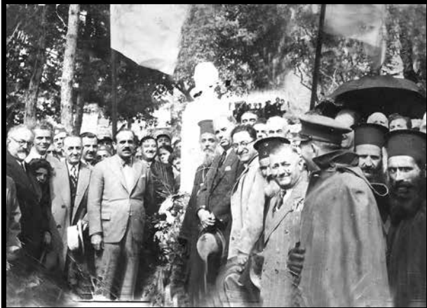
Από τα εγκαίνια της προτομής του Παπαρρηγόπουλου στη Βυτίνα 1-10-1939.