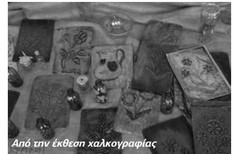
Από την έκθεση χαλκογραφίας

Η δεύτερη έκθεση περιελάμβανε έργα σύγχρονης λαϊκής τέχνης καθώς και δημιουργίες μελών του "Ομίλου κυριών" από τα δωρεάν μαθήματα χειροτεχνίας (χαλκογραφίες, έργα με την τεχνική απομίμησης μετάλλου, ζωγραφική σε γυαλί) που γίνονται στη Βυτίνα και τη Νυμφασία κάθε Τετάρτη από την κ. Ελένη Σχίζα. Η έκθεση όπως είπαμε και πιο πάνω έγινε με πρωτοβουλία του "ομίλου" και έδειξε το σπουδαίο καλλιτεχνικό και πολιτιστικό έργο που συντελείται.