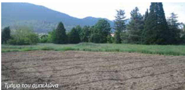
Τμήμα του αμπελώνα

Πριν από ενάμιση χρόνο περίπου (τον Οκτώβριο του 2013) και κατά τις εορτές μνήμης των εκατόν πενήντα χρόνων από το θάνατο του μεγάλου ευεργέτη Παναγιώτη Τριανταφυλλίδη τη Βυτίνα είχε επισκεφθεί ο τότε πρόεδρος Δημοκρατίας κ. Κάρολος Παπούλιας συνοδευόμενος από τον Υπουργό Γεωργικής Ανάπτυξης κ. Αθανάσιο Τσαυτάρη. Ο υπουργός είχε αναγγείλει τη δημιουργία «κέντρου ορεινής οικονομίας» στο Τριανταφυλλίδειο κτήμα και την επανακαλλιέργειά του. Το κληροδότημα Τριανταφυλλίδη έσπευσε να χρηματοδοτήσει την πρώτη φάση των εργασιών με 312.000 €. Όμως από την εξαγγελία μέχρι την υλοποίηση υπάρχει μεγάλη απόσταση, διότι παρεμβάλλεται ο «δαίμονας» της γραφειοκρατίας και χρειάζονται, εκτός της χρηματοδότησης, εργασίες γεωτεχνικές, οι οποίες απαιτούν ανθρώπινο τεχνικό και υπαλληλικό δυναμικό.