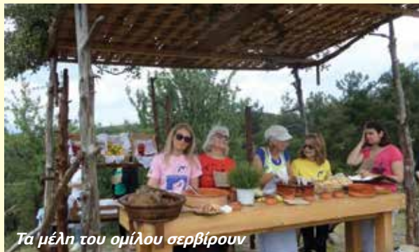
Τα μέλη του ομίλου σεβρίουν