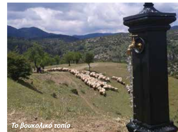
Το βουκολικό τοπίο