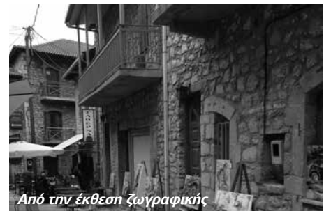
Από την έκθεση ζωγραφικής

των εικόνων και των διαδρομών οδηγών και επιβατών, που τα χρησιμοποίησαν για το ταξίδι τους. Οι αναμνήσεις είναι αυτές που τα καθιστούν αθάνατα και τα ταξιδεύουν αιώνια μέσα στον χρόνο. Η έκθεση πραγματοποιείται κατά μήκος του