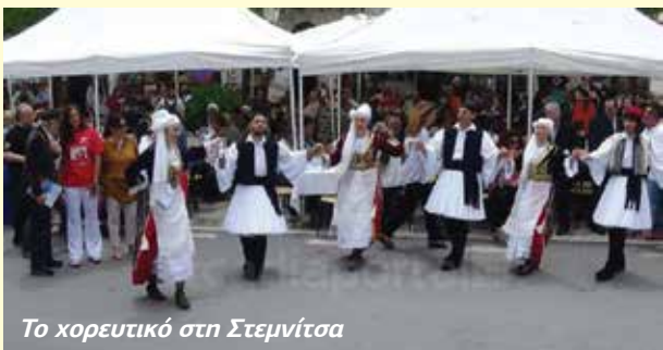
Το χορευτικό στη Στεμνίτσα

Ο σύλλογος οργάνωσε τριήμερη εκδρομή από 31 Ιουλίου μέχρι 2 Αυγούστου με την ευκαιρία της συμμετοχής στο φεστιβάλ χορευτικών και χορωδιακών συγκροτημάτων, που οργάνωσε ο πολιτιστικός σύλλογος Καλαφατιώνων Κερκύρας. Το δελτίο τύπου του συλλόγου για την εκδήλωση έχει ως εξής: «Ο πολιτιστικός σύλλογος Βυτίνας «Κων/νος Παπαρηγόπουλος» διοργανώνει τριήμερη εκδρομή (31 Ιουλίου έως 2 Αυγούστου) στο νησί της Κέρκυρας ανταποκρινόμενος στο κάλεσμα του πολιτιστικού συλλόγου Καλαφατιώνων. Το Σάββατο 1 Αυγούστου θα διεξαχθεί το ετήσιο φεστιβάλ χορευτικών συγκροτημάτων και θα συμμετέχει το χορευτικό και χορωδιακό τμήμα του συλλόγου μας. Υπάρχει διαθεσιμότητα και για άλλους εκδρομείς που θέλουν να συμμετέχουν στην εκδρομή Η διαδρομή που θα ακολουθηθεί είναι: ΒΥΤΙΝΑ -ΑΚΡΑΤΑ (στάση για καφέ), ΡΙΟ-ΑΝΤΙΡΡΙΟ-ΑΜΦΙΛΟΧΙΑ-ΜΕΝΙΔΙ ΑΡΤΑΣ για μεσημεριανό φαγητό. Αναχώρηση για ΗΓΟΥΜΕΝΙΤΣΑ και επιβίβαση στο ferryboat για ΚΕΡΚΥΡΑ. Βραδινό φαγητό στην πόλη της Κέρκυρας. Το Σάββατο 1η Αυγούστου επίσκεψη στο Αχίλλειο σε εργοστάσιο παραγωγής Κουμ - Κουάτ και στη συνέχεια στην πόλη της Κέρκυρας, μεσημεριανό φαγητό στο Κανόνι και προαιρετική επίσκεψη στο Ποντικονήσι. Το βράδυ συμμετοχή στην εκδήλωση του πολιτιστικού