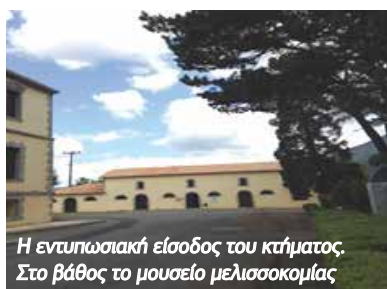
Η εντυπωσιακή είσοδος του κτήματος. Στο βάθος το μουσείο μελισσοκομίας