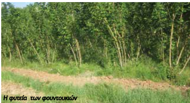
Η φυτεία των φουντουκιάων

φυτά του ίδιου δένδρου με «μολυσμένο» το ριζικό τους σύστημα με μύκητα τρούφας για πειραματική καλλιέργεια λόγω της μεγάλης αξίας της, εάν ευδοκιμήσει η καλλιέργειά της. Στο κτήμα υπάρχουν 15 στρέμματα μπλοκιδι (μπλιές) εγκαταλελειμμένα μεν, διότι έχουν φυτευτεί προ πεντηκονταετίας, αλλά διατηρητέα και προγραμματίζεται ο καθαρισμός και η συντήρηση της συγκεκριμένης φυτείας. Η φυτεία αυτή έχει μεγάλη σημασία, διότι το Κρατικό Κτήμα Βυτίνας είναι εγγεγραμμένο ως «διατηρητής» της συγκεκριμένης ποικιλίας μπλοκιδιών στον κοινοτικό κατάλογο δενδρωδών.