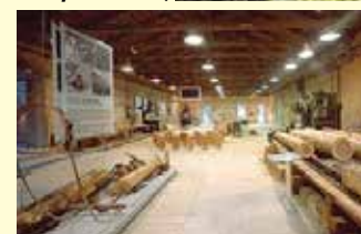
Το μουσείο ξύλου