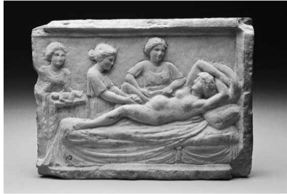
Τοκετός στην Αρχαία Ελλάδα.

Έτσι επενοήθη πλήθος προλήψεων, που έγιναν ἔθιμα και διατηρήθηκαν δια μέσου των αιώνων. Όταν γεννιόταν το παιδί, οι αρχαίοι πρόγονοί μας στόλιζαν την πόρτα και τα παράθυρα του σπιτιού με κλάδους δάφνης, αν το νεογέννητο ήταν αρσενικό, ενώ αν ήταν θηλυκό κρεμούσαν στην πόρτα ένα «ποκάρι» μαλλιά από πρόβατο, όπως αναφέρει ο Ησυχίος (5ος μ. Χ. αιώνας). Η μαία απέκοπε τον ομφάλιο λώρο, τον οποίον έθαπταν στο προαύλιο εκκλησίας ή σχολείου, για να έχει το νεογέννητο ευσέβεια και φιλομάθεια. Ενώ το έλουαν με κλιαρό αλατισμένο νερό, οι