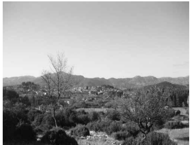
Ηλιόλουστα Χριστούγεννα στη Βυτίνα.

Χριστούγεννα: Μια από τις δυο μεγαλύτερες γιορτές της Χριστιανοσύνης. Γιορτάστηκε με την ανάλογη θρησκευτική ευλάβεια από τους πολυάριθμους Βυτιναίους και φίλους του τόπου μας που επέλεξαν τη Βυτίνα, για να περάσουν τις γιορτές. Πανηγυρική η πρωινή θεία λειτουργία στο μητροπολιτικό ναό του Αγίου Τρύφωνα και κατάμεστος ο ναός από πιστούς. Η Χριστουγεννιάτικη λειτουργία τελείωσε στις 08.30 το πρωί και οι χώροι της πλατείας άρχισαν να γεμίζουν και μέχρι το μεσημέρι δημιουργήθηκε το αδιαχώρητο στην πλατεία και τους γύρω δρόμους, αφού ο πολύ καλός καιρός επέτρεπε και την υπαίθριο παραμονή. Τα αυτοκίνητα σε διπλές και τριπλές σειρές παρκαρίσματος έφταναν μέχρι τις «κατασκηνώσεις». Τα της ημέρας με μεγαλύτερη λεπτομέρεια θα διαβάσετε σε άλλη στήλη. Από χτες άρχισε η λειτουργία του χιονοδρομικού χωρίς βέβαια χιόνι αλλά μόνο για επίσκεψη του «σαλέ». Αντίθετα στο χιονοδρομικό του Χελμού λειτουργούν κάποιες πίστες στο μεγαλύτερο υψόμετρο. Ο καθαρός ουρανός μας επέτρεψε να απολαύσουμε τη Χριστουγεννιάτικη «πανσέληνο» κάτι που είχε να συμβεί τριανταοκτώ χρόνια, όπως μας πληροφόρησε το αστεροσκοπείο Αθηνών. Ο «όμιλος κυριών» οργανώνει Χριστουγεννιάτικη παιδική εβδομάδα στα διάφορα ξενοδοχεία της Βυτίνας προσφέροντας ψυχαγωγία στους μικρούς Βυτιναίους. Με αυτά τα σχόλια τελειώνει το 2015 και ευχόμαστε σε όλους τους Βυτιναίους και φίλους της Βυτίνας με υγεία και χαρά να δεχτούμε το 2016 και μακάρι να είναι καλύτερο από αυτό που φεύγει.