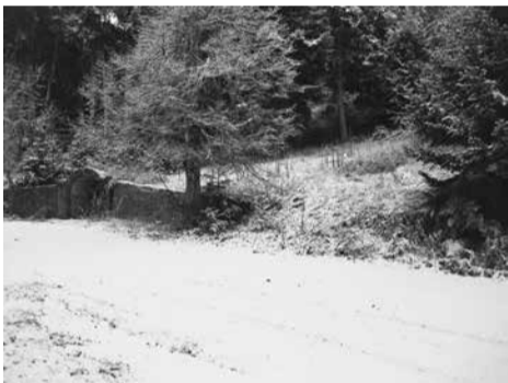
Η χιονισμένη Αλογοβρυσά

Πρώτο Σαββατοκύριακο του Δεκέμβρη. Ικανοποιητική η κίνηση των επισκεπτών. Παγωνιά επικρατεί τις νυκτερινές και πρωινές ώρες με θερμοκρασίες κάτω από το μηδέν. Τα ξημερώματα της Δευτέρας σημειώθηκε η κατώτερη θερμοκρασία με -5°C. Επίσκεψη στη Βουλή των Ελλήνων στην Αθήνα πραγματοποιήσε το Γυμνάσιο και Λύκειο τη Δευτέρα 7-12 όπου ενημερώθηκε για τη λειτουργία του κορυφαίου θεσμού της δημοκρατίας, που είναι το κοινοβούλιο, και οι μαθητές ξεναγήθηκαν στους χώρους του. Η Βυτίνα στολίζεται ενόψει των Χριστουγέννων αλλά μεγάλο πρόβλημα υπάρχει σχετικά με την καθαριότητα, η οποία είναι εξαιρετικά πλημμελής. Τη Δευτέρα το βράδυ ένας νέος σεισμός, από τους πολλούς που έχουν γίνει φέτος, μας «ταρακούνησε». Ο σεισμός προήρχετο από το γνωστό εστιακό χώρο κοντά στη Δημητσάνα και είχε μέγεθος 3,5 βαθμούς της κλίμακας Ρίχτερ. Όπως διαβάζουμε στα διαδικτυακά μέσα της Αρκαδίας, ο σεισμός έγινε ιδιαίτερα αισθητός και στην Τρίπολη. Ο τόπος μας προβάλλεται από όλα τα μέσα ενημέρωσης ως το πρώτο χειμερινό τουριστικό θέρετρο της Αρκαδίας, που θα δεχτεί τους περισσότερους επισκέπτες τις εορτές των Χριστουγέννων. Η πληρότητα στα καταλύματα εγγίζει το 100%. Δύσκολα κάποιος βρίσκει δωμάτια για τα Χριστούγεννα, ενώ πολύ λίγα υπάρχουν για την Πρωτοχρονιά.