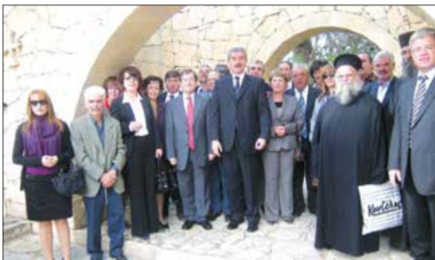
Η αντιπροσωπεία της Βυτινάς στο μοναστήρι του Αρκαδίου το 2008 στις γιορτές αδελφοποίησης

Στη μπαρουταποθήκη της μονής γράφτηκε η τελευταία πράξη του δράματος και μία ακόμα ένδοξη σελίδα της ελληνικής ιστορίας. Ο Κωστής Γιαμπουδάκης ή κατ' άλλους ο Εμμανουήλ Σκουλάς την ανατίναξε, σκορπίζοντας το θάνατο όχι μόνο στους χριστιανούς, αλλά και στους εισβολείς. Αμέσως μετά οι Τουρκοκρητικοί και οι Αλβανοί όρμησαν και κατέσφαξαν όσους είχαν διασωθεί, ενώ έκαμαν τον ναό και λεηλάτησαν τα ιερά κειμήλια. Από τους Έλληνες που βρίσκονταν στη Μονή, μόνο 3 ή 4 κατόρθωσαν να διαφύγουν (μεταξύ αυτών και η ηρωίδα Χαρίκλεια Δασκαλάκη), ενώ περίπου 100 πιάστηκαν αιχμάλωτοι. Μεταξύ αυτών και ο Δημακόπουλος, που εκτελέστηκε λίγο αργότερα. Ο ηγούμενος της Μονής Αρκαδίου Γαβριήλ Μαρινάκης είχε σκοτωθεί πριν από την ανατίναξη της μπαρουταποθήκης. Οι νεκροί και τραυματίες Τούρκοι στρατιώτες ανήλθαν σε 1.500 ή σε 3.000,