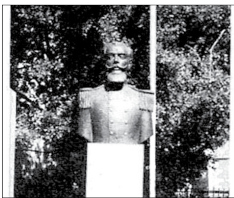
Ιωάννης Δημακόπουλος (η προτομή του στη Βυτίνα)

σύμφωνα με κάποιους άλλους υπολογισμούς.