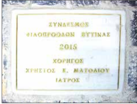
Η νέα είσοδος στο αλσύλλιο και η αφιερωματική πλάκα