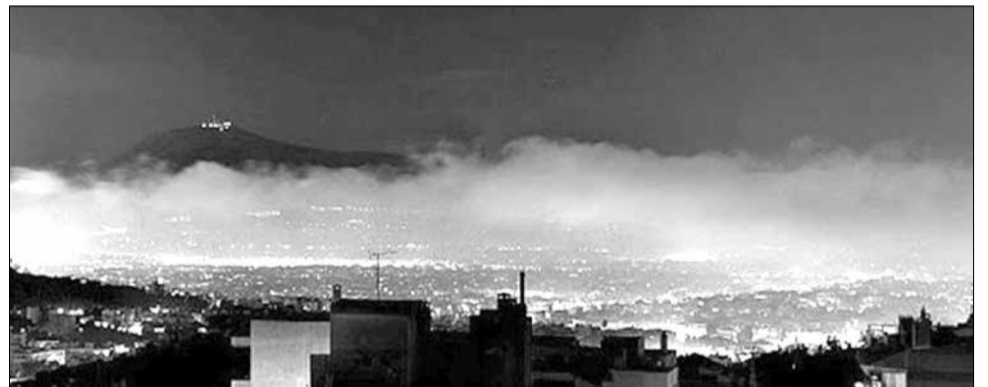
Φωτογραφία της Αθήνας το Δεκέμβριο του 2012

Δυσμενείς συνθήκες τοπογραφικές και μετεωρολογικές (χαμηλές θερμοκρασίες και υγρασία), και πολυπληθείς εστίες στερεών καυσίμων σε πυκνοκατοικημένα αστικά κέντρα της χώρας εντείνουν το φαινόμενο, ενώ η χρήση «επιλήψιμων» καυσίμων (πλαστικά, βαμμένα ξύλα, μελαμίνες κ.ά.) οξύνει περισσότερο το πρόβλημα.