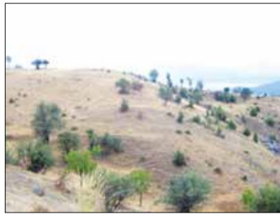
Το παλιό αμπελοτόπι στα «Λακώματα»

Τρυγητής: Μήνας και αυτός με μεγάλη κινητικότητα για την αγροτική κοινωνία της Βυτίνας στο παρελθόν. «Θέρος, τρύγος, πόλεμος» λέει η λαϊκή παροιμία προσδιορίζοντας τα τρία σημαντικά γεγονότα, που απαιτούσαν κινητοποίηση και μαζική συμμετοχή ανδρών και γυναικών, μικρών και μεγάλων. Το τρίτο δεκαήμερο του Σεπτέμβρη και το πρώτο του Οκτώβρη ήταν «αφιερωμένο» στον τρύγο, μια από τις σπουδαιότερες γεωργικές απασχολήσεις. Το κρασί, μαζί με το λάδι και το ψωμί αποτελούσε τη βάση της διατροφής της αγροτικής κοινωνίας. Το πρώτο και το τρίτο παρήγοντο από το Βυτιναίο αγρότη. Το δεύτερο ή το προμηθευόταν ή το υποκαθιστούσε με άλλα