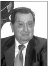
ΓΡΑΦΕΙ: ο εκ Νυμφασίας φιλόλογος Κων/νος Τρ. Γιαννημάρας

Ζούμε στον 21ο μ.Χ. αιώνα. Δε μπορούμε να υπολογίσουμε πόσα εκατομμύρια ή δισεκατομμύρια χρόνια έχουν προηγηθεί μέχρι σήμερα, ούτε πόσα θα ακολουθήσουν και τούτο, διότι ο χρόνος είναι απόλυτος - αιώνιος και η ανθρώπινη νοητική ικανότητα αδυνατεί να εγγίζει ούτε την αρχή ούτε το τέλος του, παρά μόνο το σχετικό χρόνο, που είναι πεπερασμένος και μετρήσιμος, διότι μέσα σ' αυτόν αναπτύσσεται η επίγεια ζωή του ανθρώπου. Ο χρόνος όπως και ο χώρος ως πρωταρχικές αρχές και έννοιες δεν είναι δυνατόν να οριστούν με πραγματικό ορισμό, καθότι είναι έξω και υπεράνω από την ανθρώπινη διάνοια και τούτο, διότι τακτοποιήθηκαν πριν από τη δημιουργία του Σύμπαντος Κόσμου και κυβερνώνται από το Δημιουργό. Αυτό έρχεται να μας πιστοποιήσει η Εκκλησία με το θεόπνευστο μήνυμα όσον αφορά την κυριαρχία αυτών των αρχών, για μεν το χώρο το «ο πανταχού παρών και τα πάντα πληρών», για δε το χρόνο αυτό που είπε ο Χριστός στους μαθητές του, όταν αυτοί τον ρώτησαν πότε θα αποκαταστήσει την βασιλεία στο Ισραήλ και Αυτός είπε: «Οὐκ ὑμῶν ἐστὶ γινῶναι χρόνους ἢ καιρούς οὐς ὁ Πατήρ ἔθετο ἐν τῇ ἰδίᾳ ἐξουσίᾳ», όπως μας το διηγείται ο ευαγγελιστής Λουκάς στο 10ο κεφάλαιο των πράξεων των Αποστόλων.