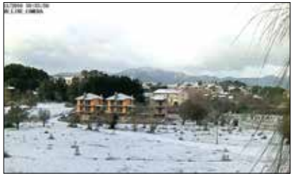
Χιόνι στη Βυτίνα στις 29-12-2016, λίγο πριν φύγει ο παλιός χρόνος

1η ΓΕΝΑΡΗ 2017: Αρχιμηνιά κι' Αρχικρονιά. Ήρθε ο καινούριος χρόνος με αρκετό κρύο. Τις προηγούμενες μέρες η θερμοκρασία κτύπησε... κόκκινο με τιμές κάτω του μηδενός, αφού την περασμένη Παρασκευή το θερμόμετρο έδειξε -9°C. Το Σαββατοκύρια-