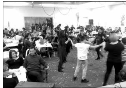
Από τη γιορτή του συλλόγου γονέων Δημοτικού και Νηπιαγωγείου

Τρίτο Σαββατοκύριακο του Φλεβάρη. Κυριακή των «κρεατινών» Απόκρεω. Ικανοποιητική κίνηση από επισκέ-