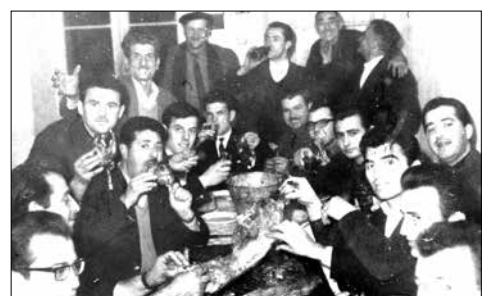
Κυριακή του Ασώτου 1966