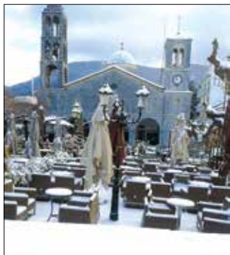
Η χιονισμένη πλατεία το Σάββατο 7-1

Τριήμερο των Φώτων: Οι τρεις μέρες αργίας επέτρεψαν σε πολλούς να επισκεφθούν πάλι τη Βυτίνα. Μπορεί η επισκεψιμότητα να μην έφτασε το επίπεδο των Χριστουγέννων αλλά τα καταλύματα σημείωσαν μεγάλο ποσοστό πληρότητας. Οι ειδήσεις για απότομη πτώση θερμοκρασίας και έλευση του χιονιά, που δε σημειώθηκε στην ένταση που παρουσιάστηκε από τα δελτία ειδήσεων, έκανε κάποιους να αναβάλουν το ταξίδι τους. Η πανηγυρική λειτουργία τελέστηκε σε κατανυκτική ατμόσφαιρα στον Ι.Ν. του Αγίου Τρύφωνα όπου πραγματοποιήθηκε και η τελετή του αγιασμού των υδάτων. Το Σάββατο έορτασαν οι Γιάννηδες και οι Ιωάννες του χωριού που είναι αρκετοί. Οι καφετέριες και οι δρόμοι γεμάτοι, παρόλο το τσουκτερό κρύο και τις χαμηλές θερμοκρασίες. Το χιόνι το Σάββατο 7-1