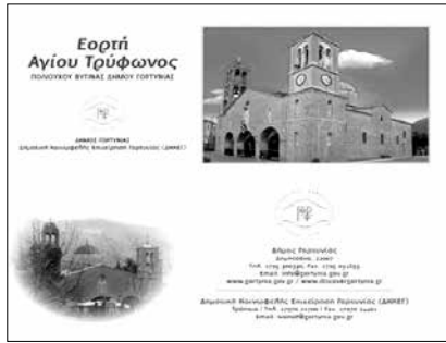
Η Δημοτική πρόσκληση για τη γιορτή του Αγίου Τρύφωνος

που ήθελαν να απολαύσουν το χιόνι του χιονοδρομικού, αν και ο δρόμος από Βυτίνα ήταν κλειστός, όπως πληροφορεί η ιστοσελίδα του χιονοδρομικού, ενώ από τον Καρδαρά είναι ανοικτός. Δυστυχώς φέτος κατά τη διάρκεια των Γενναριάτικων χιονοπτώσεων ο δρόμος προς το χιονοδρομικό από Βυτίνα έμεινε κλειστός, παρόλο που το χιονοδρομικό είναι ένας σημαντικός πόλος έλξης για τους επισκέπτες του χειμώνα.