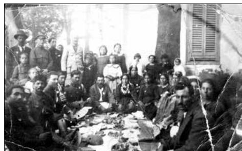
Τσικνοπέμπη τη δεκαετία του 1920 σε Βυτινώτικη αυλή