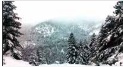
Το χιονισμένο Μαίναλο στις 12-1

σεις λόγω της αναγγελθείσης κακοκαιρίας, η οποία τελικά δεν ήταν τόσο μεγάλη, όσο την παρουσίασαν οι μετεωρολόγοι. Κατά γενική ομολογία η διογκωμένη παρουσίαση της κα-