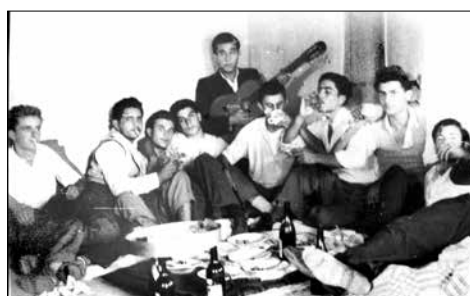
Αρχές της δεκαετίας του εξήντα Τσικνοπέμπη