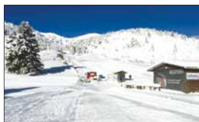
Το χιονοδρομικό στις 19-1

Εβδομάδα του χιονιού: Έτσι θα μπορούσαμε να ονομάσουμε την Τρίτη εβδομάδα του Γενάρη, αφού οι χιονοπτώσεις συνεχίστηκαν όπως και οι χαμηλές θερμοκρασίες κάτω του μηδενός. Την Τρίτη 17-1 και πάλι δεν πραγματοποιήθηκαν μαθή-