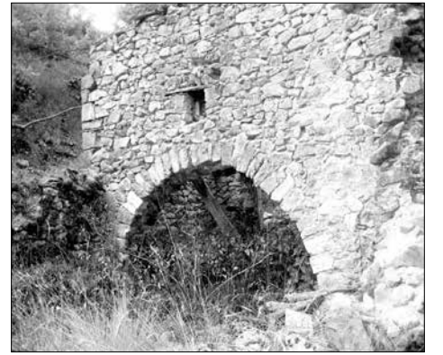
Ο μύλος του Τσελεπή όταν λειτουργούσε και όπως είναι σήμερα

από τα «κακά πνεύματα» και τα «ξωτικά», τα οποία θα συναντούσε στο δρόμο. Εξάλλου οι τοποθεσίες αυτές με νερά, ρέματα, πυκνόφυτες περιοχές ήταν κατοικίες καλών και κακών πνευμάτων, νεράιδων και άλλων, που μπορούσαν να μολύνουν το γέννημα και να βλάψουν κατ' επέκταση το σπίτι. Σε όσα σπίτια είχαν γλάστρα με απήγανο, έβαζαν και ένα κλαδάκι στο σαμάρι, αφού ο απήγανος ήταν αποτρεπτικός του κακού.