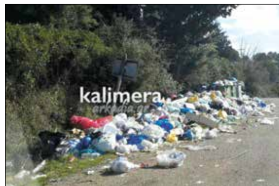
Ένας δρόμος της Γορτυνίας, όπως προβλήθηκε από το Kalimera Arkadia

Τέλη Οκτωβρίου, όπως είναι γνωστό, έκλεισαν όλες οι κωματερές και μέσα σε αυτές και της Βυτίνας, οι οποίες δε συγκέντρωναν τις προδιαγραφές της σωστής λειτουργίας και είχαν υποτυπώδη οργάνωση. Κάθε παράταση λειτουργίας τιμωρείτο με βαρύ πρόστιμο, το οποίο θα κατέβαλαν οι δήμοι ή η περιφέρεια Πελοποννήσου. Παρόλο όμως που το θέμα αυτό ήταν γνωστό από διετίας περίπου, οι αρμόδιοι φορείς και πιο συγκεκριμένα ο δήμος Γορτυνίας, η περιφέρεια Πελοποννήσου και το Υπουργείο Περιβάλλοντος αδιαφορούσαν για την εύρεση εναλλακτικής λύσης, έως ότου φτάσαμε στο αδιέξοδο, που όλοι αντιμετωπίζουμε με τα σκόρπια σκουπίδια στους κάδους, τα οποία δημιουργούν όχι μόνο ένα άκρως αντιαισθητικό θέαμα, αλλά και τεράστιο κίνδυνο για την υγεία των πολιτών.