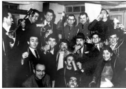
Κυριακή του «Ασώτου» πριν πενήντα χρόνια στη Βυτίνα

της η Παγγορτυνιακή ένωση και την Κυριακή ο σύλλογος των Απανταχού Βυτιναίων με την παρουσία αρκετού κόσμου. Λεπτομέρειες θα διαβάσετε σε άλλη στήλη. Την Κυριακή το μεσημέρι έφτασαν τρία πούλμαν εκδρομικών από την Κόρινθο, οι οποίοι γέμισαν την πλατεία και περιήλθαν τους δρόμους και τα καταστήματα εμπορίας τοπικών προϊόντων.