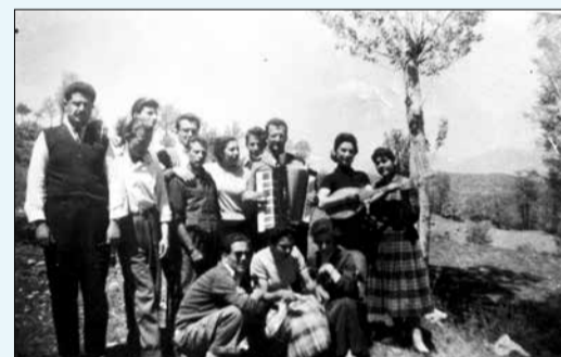
Μαγιάτικη εκδρομή 1960