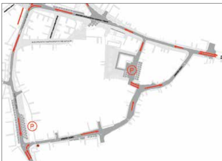
Προτεινόμενες ρυθμίσεις μονοδρομήσεων - εξωτερικός δακτύλιος κέντρου Βυτινίας

πλακόστρωση των οδών με τη διαπεδότηση, που προτείνεται στην μελέτη, θα βελτιώσει καθοριστικά την εικόνα της τοπικής κοινότητας στην περιοχή παρέμβασης. Θα γίνει διαμόρφωση αριστερά και δεξιά της κεντρικής οδού του οικισμού με αντίστοιχη μείωση του πλάτους διέλευσης των οχημάτων και διαμορφώσεις πλακόστρωτων λωρίδων διέλευσης