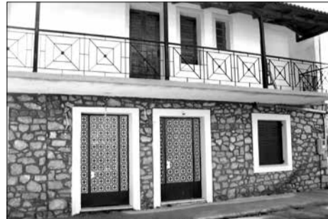
Το ίδρυμα Θαλασσινού όπου στεγάζεται ο πολιτιστικός σύλλογος

Αποφασίσαμε μετά από διαλογική συζήτηση να κάνουμε την πρώτη μας χορευτική εκ-