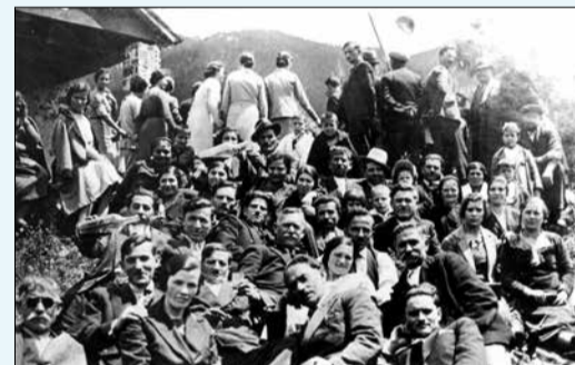
Εορτή του συλλόγου επαγγελματιών στον Αϊ Θανάση της «Ζωοδόχου Πηγής» 1958