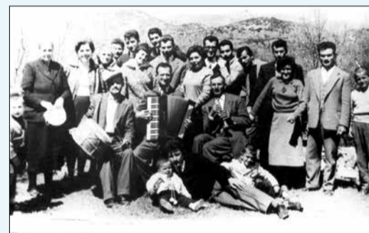
Γιορτή επαγγελματιών 1961