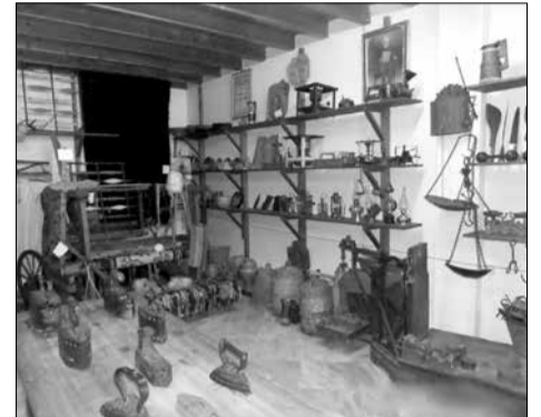
Το εσωτερικό του λαογραφικού μουσείου

Αρχικά σκεφτήκαμε να απευθυνθούμε στον σύλλογο Φιλοπροόδων πιστεύοντας ότι είναι πολύ κοντά στο αντικείμενο. Όμως η προσπάθεια που έγινε συναντώντας τότε τον πρόεδρο του συνδέσμου Φιλοπροόδων αείμνηστο Δημήτριο Μπαμπίλη απέβη άκαρπη, αφού μας πληροφορήσε ότι ο σύνδεσμος δεν είχε τέτοιους σκοπούς. Τότε μη έχοντας άλλη λύση αρχίσαμε να σκεφτόμαστε τη δημιουργία νέου συλλόγου, που θα μπορούσε να καλύπτει τις δραστηριότητες τις οποίες είχαμε ξεκινήσει αλλά και άλλες μελλοντικές, που θα προέκυπταν. Έτσι από το φθινόπωρο του 1996 μέχρι και τον Οκτώβριο του 1997, σε διάστημα ενός χρόνου, προέκυψε ο πολιτιστικός σύλλογος περιοχής Βυτίνας «Κωνσταντίνος Παπαρρηγόπουλος», (τη λέξη «περιοχής» την βάλαμε, για να μπορούν να εγγραφούνται και από τα γειτονικά χωριά μέλη, αφού αναμενόταν η συνένωση των κοινοτήτων με τον «Καποδίστρια»).