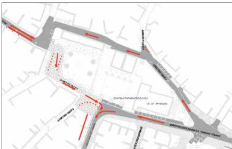
Προτεινόμενη κυκλοφοριακή διαμόρφωση περιμετρικά της κεντρικής πλατείας Παπαρρηγοπούλου

1. Προτεινόμενη ανάπλαση: Μετά τη διαπίστωση της υποβαθμισμένης κατάστασης του κέντρου της κωμόπολης ιδιαίτερα από απόψεις κίνησης πεζών και οχημάτων τις περιόδους μεγάλης επισκεψιμότητας, κρίνεται επιτακτική η ανάγκη ανάπλασής του. Η