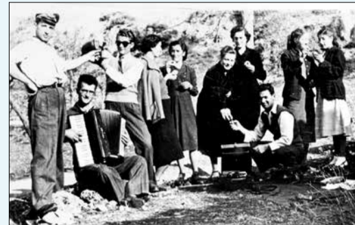
Εκδρομή στο «παραδείσι» αρχές της δεκαετίας του 1950 με την ευκαιρία της γιορτής του Αγίου Νικολάου

Πολλά από τα πρόσωπα δεν είναι πλέον ανάμεσα μας. Άλλα όμως (τα λιγότερα) ζουν και θυμούνται τις ανεπανάληπτες αυτές στιγμές, που δημιούργησαν σιγά-σιγά την ακατάλυτη λαϊκή παράδοση του τόπου μας.