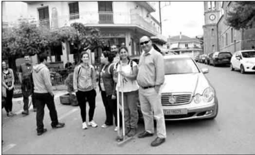
Οι εθελοντές στην πλατεία της Βυτίνας