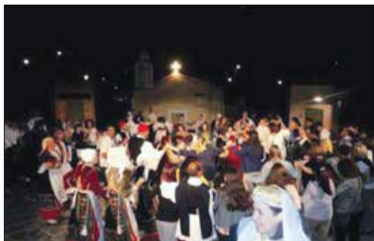
Από την εκδήλωση του πολιτιστικού

δεν ήταν ομοιόμορφο από απόψεως επισκεψιμότητας. Ο μεν Ιούνιος και Ιούλιος, ως συνήθως, με μικρότερη κίνηση, ενώ ο Αύγουστος περισσότερο κινητικός με κορύφωση το πρώτο δεκαπενθήμερο και την εορτή της Παναγίας. Η κίνηση αυτή δημιουργήθηκε περισσότερο από την επίσκεψη ντόπιων, που έφτασαν για λίγες ή περισσότερες μέρες στο χωριό τους και λιγότερο από τους παραδοσιακούς καλοκαιρινούς φίλους της Βυτίνας, οι οποίοι διαρκώς μειώνονται, αφού η θάλασσα είναι περισσότερο ελκυστική το καλοκαίρι. Η Αυγουσιάτικη καθημερινή κίνηση ήταν αρκετά πυκνή, διότι ο τόπος μας λόγω υποδομής εξυπηρετεί από απόψεως προσφοράς υπηρεσιών και ψυχαγωγίας και την ευρύτερη περιοχή.