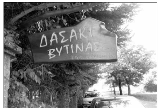
Η καλαίσθητη πινακίδα εισόδου

Το δασάκι αποτελεί ένα από τα σημαντικότερα αξιοθέατα και