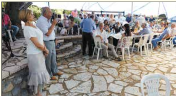
Ο χαιρετισμός του προέδρου