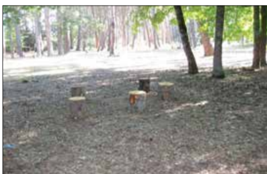
Το ανακαινισμένο δασάκι

δεν ήταν ομοιόμορφο από απόψεως επισκεψιμότητας. Ο μεν Ιούνιος και Ιούλιος, ως συνήθως, με μικρότερη κίνηση, ενώ ο Αύγουστος περισσότερο κινητικός με κορύφωση το πρώτο δεκαπενθήμερο και την εορτή της Παναγίας. Η κίνηση αυτή δημιουργήθηκε περισσότερο από την επίσκεψη ντόπιων, που έφτασαν για λίγες ή περισσότερες μέρες στο χωριό τους και λιγότερο από τους παραδοσιακούς καλοκαιρινούς φίλους της Βυτίνας, οι οποίοι διαρκώς μειώνονται, αφού η θάλασσα είναι περισσότερο ελκυστική το καλοκαίρι. Η Αυγουσιάτικη καθημερινή κίνηση ήταν αρκετά πυκνή, διότι ο τόπος μας λόγω υποδομής εξυπηρετεί από απόψεως προσφοράς υπηρεσιών και ψυχαγωγίας και την ευρύτερη περιοχή.