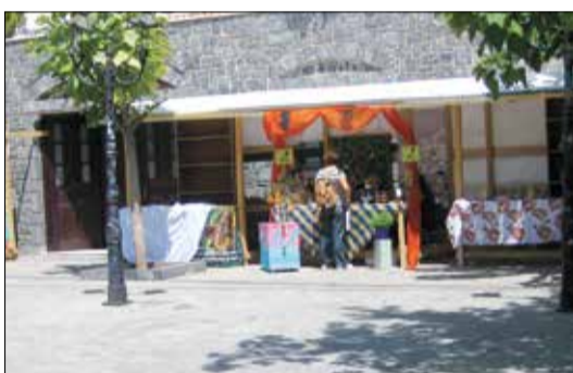
Το 5ο φεστιβάλ μελιού

λόγω του έργου της αποχέτευσης. Η αποκατάσταση άρχισε και διεκόπη αιφνιδώς για καθαρά γραφειοκρατικούς λόγους και δεν γνωρίζουμε πότε θα συνεχιστεί το έργο. Το θέμα αυτό το αναφέραμε και στο περσινό αντίστοιχο φύλλο αλλά δυστυχώς εξακολουθεί να υφίσταται. Άλλα προβλήματα που παρουσιάστηκαν ήταν: οι μικρές διακοπές νερού, ο ηλεκτροφωτισμός