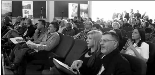
Οι σύνεδροι στο προσφάτως ανακαινισμένο Πανταζοπούλειο πνευματικό κέντρο Βυτίνας

Σημαντική προβολή για την περιοχή αποτέλεσε και η προσέλευση ως πεζοπόρων επισκεπτών, σημαντικών προσωπικοτήτων της Βρετανίας, μεταξύ των οποίων ο πρώην προσωπικός γραμματέας της Βασίλισσας Ελισάβετ Λόρδους Fellowes και η σύζυγός του, Λαϊδη Fellowes, η οποία τυγχάνει αδερφή της θανούσας πριγκίπισσας Νταϊάνα και ο Λόρδος Butler, ο οποίος έχει διατελέσει προσωπικός γραμματέας αρκετών πρωθυπουργών της Βρετανίας όπως οι Edward Heath, Harold Wilson, Margaret Thatcher, Tony Blair κ. Όραμα της Μαίναλον Κοιν.Σ.Επ. είναι το Μονοπάτι του Μαϊνάλου - Menalon Trail να αποτελέσει και να καθιερωθεί ως πρότυπο οργάνωσης και λειτουργίας μεταξύ των μονοπατιών πεζοπορίας στην Πελοπόννησο και την υπόλοιπη Ελλάδα με τη συνεργασία της τοπικής κοινωνίας, των