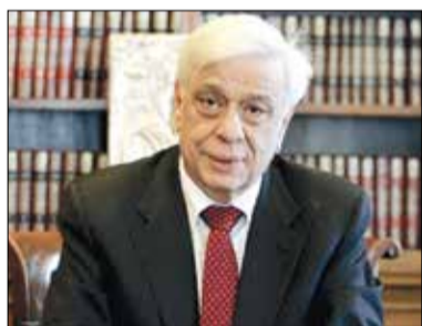
Ο πρόεδρος της Ελληνικής Δημοκρατίας κ. Προκόπης Παυλόπουλος που αναμένεται στη Βυτίνα την 1η Φεβρουαρίου

θα επισκεφθεί τη Βυτίνα την 1η Φεβρουαρίου, θα τιμήσει την εορτή του πολιούχου Αγίου Τρύφωνα και θα εγκαινιάσει το ανακαινισθέν Πανατζοπουλείο πνευματικό κέντρο, το οποίο μετετράπη σε σύγχρονο συνεδριακό. Η σκέψη της πρόσκλησης καλλιεργήθηκε από τον δήμο Γορτυνίας και τους διαχειριστές του κληροδοτήματος και μετουσιώθηκε σε γραπτό κείμενο, το οποίο εστάλη στην προεδρία της Δημοκρατίας. Η απάντηση ήταν καταφατική και η επίσκεψη ορίστηκε για την 1η Φεβρουαρίου, ώστε να υλοποιηθεί ο σκοπός της πρόσκλησης δηλαδή να πραγματοποιηθούν τα εγκαίνια της ανακαινισμένης αίθουσας από τον πρόεδρο της δημοκρατίας και συγχρόνως να τιμηθεί ο πολιούχος της Βυτίνας, που την ημέρα αυτή εορτάζει. Επομένως η Βυτίνα θα υποδεχθεί για τέταρτη φορά πρόεδρο της δημοκρατίας με την αρμόζουσα τιμή και τον ανάλογο σεβασμό.