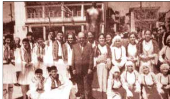
Από την επίσκεψη του αιμίηστου προέδρου Κωστή Στεφανόπουλου το 2003

Ο τόπος μας έχει εμπειρία από παρόμοιες υψηλές επισκέψεις και είναι ο μοναδικός από όλη τη Γορτυνία και ίσως την Αρκαδία, που τον έχουν επισκεφθεί τέσσερις φορές τρεις διαφορετικοί πρόεδροι της Ελληνικής δημοκρατίας, για διαφορετικές αιτίες ο καθένας αλλά έχουν τύχει των ιδίων τιμών και του ανάλογου σεβασμού. Και για να αναδιψάσουμε την τοπική ιστορία και να την φέρουμε στη μνήμη των αναγνωστών, η πρώτη επίσκεψη έγινε από τον αιμίηστο Κωστή Στεφανόπουλο στις 31-8-1997 στα πλαίσια περιοδείας του στους νομούς της Πελοποννήσου. Όπως θυμούνται οι παλιότεροι τον αιμίηστο Κωστή Στεφανόπουλο υποδέχθηκαν ο τότε πρόεδρος της κοινότητας Βυτίνας κ. Κ. Κουντάνης, ο πρόεδρος του συλλόγου των απανταχού Βυτιναίων κ. Τρύφωνας Θεοφιλόπουλος και σύσσωμη η Βυτίνα αλλά και η γύρω περιοχή. Ο τότε πρόεδρος της κοινότητας κ. Κουντάνης προσέφερε κατά την υποδοχή στον πρόεδρο βιβλίο με την ιστορία του μεγάλου Βυτιναίου γεωγράφου Παναγιώτη Ποταγού, ενώ ο πρόεδρος του συλλόγου των απανταχού Βυτιναίων τον προσφώνησε με ένα πομπώδη και μεστό περιεχομένου λόγο. Η δεύτερη επίσκεψη έγινε από τον ίδιο πρόεδρο, τον