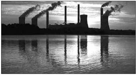
ΓΡΑΦΕΙ: Ο Στάθης Λιδωρίκης Χημικός Μηχανικός

Τον Δεκέμβριο 2015, περισσότερα από 190 έθνη και πολλές χιλιάδες μη κρατικοί φορείς αποφάσισαν από κοινού στο Παρίσι να διαφυλάξουν και να ενισχύσουν τον κοινωνικό, περιβαλλοντικό και οικονομικό ιστό της ζωής στον κοινό μας πλανήτη. Δεσμεύτηκαν να προωθήσουν έναν πιο ευημερούντα, ανθεκτικό και δίκαιο κόσμο και να θέσουν ένα όριο αύξησης της μέσης παγκόσμιας θερμοκρασίας κατά 1,5-2°C, σε σχέση με τα προ-βιομηχανικά επίπεδα. Δύο χρόνια μετά τη σημαντική αυτή συμφωνία για το κλίμα η παγκόσμια κοινότητα βρίσκεται σε ένα κρίσιμο σημείο καμπής. Σύμφωνα με εκτιμήσεις επιστημόνων του κλίματος υψηλού επιπέδου και υπεύθυνων χάραξης πολιτικής, τα επόμενα τρία χρόνια θα είναι καθοριστικά για τη μοίρα του κλίματος του πλανήτη μας. Για την αποφυγή ανυπολόγιστων κινδύνων για την ανθρωπότητα οι παγκόσμιες εκπομπές αερίων θερμοκηπίου θα πρέπει να αρχίσουν να μειώνονται μετά το έτος 2020, έτσι ώστε η αύξηση της μέσης παγκόσμιας θερμοκρασίας να κυμανθεί στα επίπεδα των 1,5-2°C, σε σχέση με τα προ-βιομηχανικά επίπεδα.