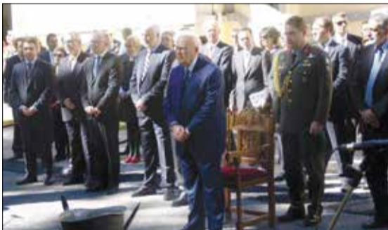
Από την επίσκεψη του προέδρου κ. Κάρου Παπούλια

αιμίηστο Στεφανόπουλο, στις 3-5-2003 με την ευκαιρία των αποκαλυπτηρίων της προτομής του Βυτιναίου ήρωα Ματθαίου Πόταγα, την οποία είχε φιλοτεχνήσει η αδελφή του διάσημη γλύπτρια Ελένη Πόταγα- Στράτου και η οποία είχε καλέσει τον πρόεδρο σε συνεργασία με τον τότε Δήμο Βυτίνας. Τον πρόεδρο της Δημοκρατίας προσφώνησε ο κ.