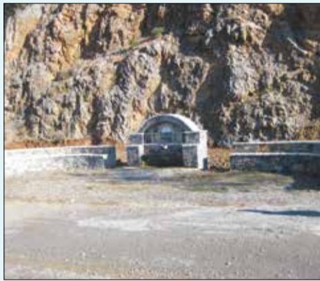
Η αδιαμόρφωτη 2η είσοδος με μόνη την καλαίσθητη βρύση του συνδέσμου φιλοπροόδων