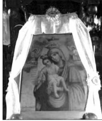
Η Παναγία της Κερνίτσας