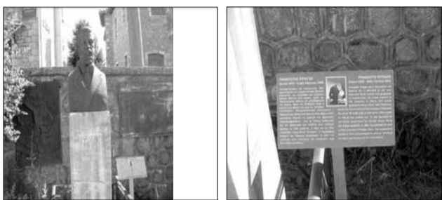
Η καλαίσθητη πινακίδα δίπλα στην προτομή του μεγάλου ξερουντή Π. Ποταγού