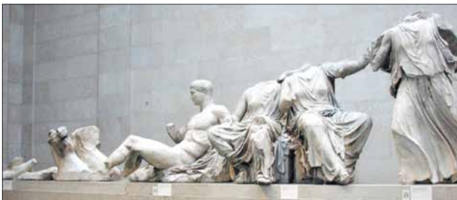
Από το ανατολικό αέτωμα του Παρθενώνα

Όλα αυτά τα εκθέματα του Βρετανικού μουσείου αντιπροσωπεύουν περίπου το μισό από τη γλυπτική διακόσμηση του Παρθενώνα που διασώθηκε. Συγκεκριμένα 75 από τα αρχικά 160 μέτρα, 15 από τις 92 μετόπες, 17 τμηματικές φιγούρες από τα αετώματα, όπως επίσης και άλλα τμήματα της αρχιτεκτονικής διακόσμησης. Όσα τμήματα του γλυπτού διακόσμου λείπουν αναπληρώνονται με εκμαγεία σε γύψο. Τα «αποκτήματα» του Έλγιν περιλαμβάνουν ακόμη αντικείμενα και από τα άλλα ιερά της Ακρόπολης, όπως το Ερέχθειο, τα Προπύλαια και τον Ναό της Αθηνάς Νίκης