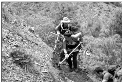
Εθελοντές καθαρίζουν το μονοπάτι

Το διασχίζουν οδοιπόροι ακόμα και από την Αλάσκα και την Κορέα