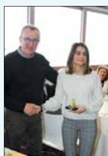
Η βράβευση των Βυτιναιών φοιτητών