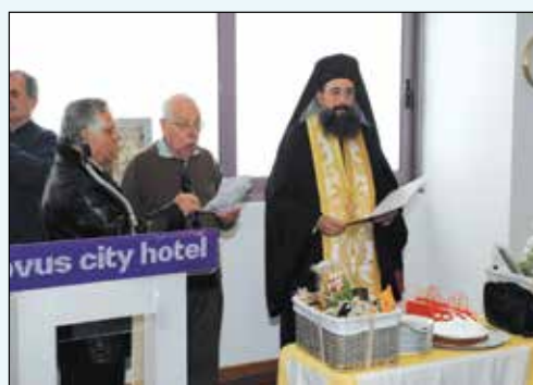
Η ευλογία της πίτας

Η φωτογραφική κάλυψη της εκδήλωσης έγινε από τον ένθερμο Βυτιναίο και παλιό μέλος του Δ.Σ. του συλλόγου κ. Χαράλαμπο Λιαρόπουλο, τον οποίο και ευχαριστούμε.