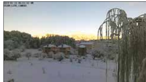
Πρωινό Κυριακής 13-1 και -4 C.

Δεύτερο Σαββατοκύριακο του Γενάρη και όλου του χρόνου. Ο χιονιάς «καλά κρατεί». Την Παρασκευή 11-1 διεκόπη η λειτουργία των σχολείων λόγω κακών καιρικών συνθηκών, ενώ την ίδια μέρα το πρωί η χιονόπτωση μέσα στη Βυτίνα ήταν ισχυρή και το «έστρωσε» πάλι προς χαρά των επισκεπτών του Σαββατοκύριακου. Η εικόνα του χωριού και της ευρύτερης περιοχής ντυμένη στα λευκά είναι εξαιρετικά ειδυλλιακή, ιδιαίτερα το χιονισμένο Μαίναλον. Το χιονοδρομικό, όπως μας πληροφορεί η ιστοσελίδα του, λειτουργεί