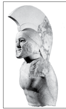
Ο Λεωνίδα (αρχαιολογικό Μουσείο Σπάρτης)

Το σπαρτιατικό ιδεώδες ήταν η αγάπη προς την πατρίδα. Από αυτή ακριβώς την αγάπη πήγαζε αυτόνοπτα η υπέρ αυτής θυσία των πάντων και αυτής ακόμη της ζωής κατά το του Τυρταίου: «Τεθνήναι γαρ καλόν ενί προμάχοισι πεσόντα, άνδρ' αγαθόν περί η πατρίδι μαρνάμενον» (Για την πατρίδα στην πρώτη γραμμή πολεμώντας να πέσει σαν παλικάρι κανείς είναι μεγάλη τιμή). Δοθείσης της πατρίδας ως υπέρτατου ιδεώδους, αποτελούσε έγκλημα καθοσιώσεως κάθε παράβαση των εντολών που εκπροσωπούσαν αυτήν, δηλ. τυφλή πειθαρχία προς τους νόμους. Τούτο αναγράφεται στο πρώο των προμάχων των πεσόντων στις Θερμοπύλες: «...τήδε κείμεθα τοις κείνων ρήμασι πειθόμενοι». Πέραν αυτών, οι Σπαρτιάτες ήταν ολιγόλογοι. Διατύπωναν τα νοήματά τους με λίγες αλλά χαρακτηριστικές λέξεις. Αυτός είναι και ο λόγος για τον οποίο η βραχυλογία λέγεται σήμερα λακωνισμός. Όταν ο Λύσανδρος έγινε κύριος των Αθηνών κατά τον πελοποννησιακό πόλεμο, στην αναφορά του προς τη Σπάρτη «επί τη αλώσει», έγραψε: «η πόλις εάλω». Η ρήση αυτή επαναλήφτηκε μυριάστοιχ 1857 χρόνια μετά κατά την Άλωση της Πόλης. Οι τρεις αυτές λέξεις ήταν ικανές να δηλώσουν το μέγα γεγονός. Ύψιστο, επίσης, παράδειγμα λακωνισμού έδωσε ο Λεωνίδα στις Θερμοπύλες με το περίφημο «Μολών λαβέ». Δεν απάντησε με μεγαλοστομία και κομπασμό. Ήρεμα, σεμνά, με το μεγαλείο του αυτοθυσιαστικού του ηρωισμού, παρέδωσε στην αιωνιότητα το περιφημότερο μάθημα