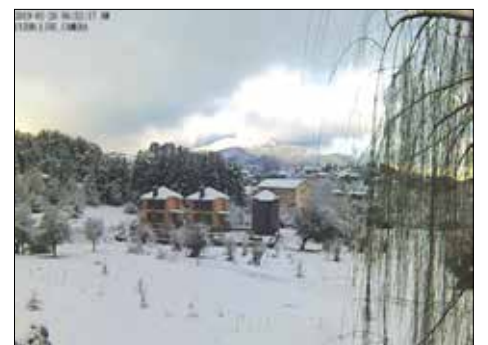
Η Βυτίνα χιονισμένη το πρωί του Σαββάτου 26-1.

Τελευταίο Σαββατοκύριακο του Γενάρη. Την Παρασκευή το απόγευμα άρχισε να χιονίζει πάλι πυκνό χιόνι, που σε λίγη ώρα το «έστρωσε», παρόλο που είχε προηγηθεί βροχή. Αυτό το Σαββατοκύριακο ήταν πολύ καλό για το χιονοδρομικό κέντρο Μαίναλου αφού έπεσε 0,60 cm καινούριο χιόνι. Στην ιστοσελίδα του αναφέρεται ότι ο φετινός Γενάρης είναι από τις πλέον παραγωγικές περιόδους λόγω των συνεχών χιονοπτώσεων. Το Σάββατο το πρωί όλα ήταν κατασπρη και το χιόνι είχε φτάσει τα 5 εκατοστά μέσα στο χωριό. Οι δρόμοι ανοικτοί και ήταν μια πραγματική απόλαυση για όσους επέλεξαν να μας επισκεφθούν και αυτό το Σαββατοκύριακο. Κίνηση ικανοποιητική με επισκέπτες της μιας μέρας για έναν καφέ στα χιόνια. Μεγαλύτερη