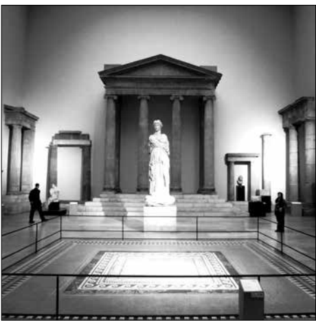
Ο Ναός της Αθηνάς

γλυφο της Μήδειας και των Πλειάδων, ο αμφορέας του Νέσσου, ο προσευχόμενος παις, η οινόχοη του Ζωγράφου, ο οπλίτης της Σάμου, Παναθηναϊκός αμφορέας, δύο σφραγιδόλιθοι και πολλά άλλα.