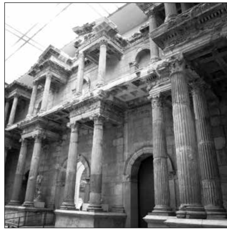
Η πύλη της αγοράς της Μιλήτου

Εκτός από αυτές τις εντυπωσιακές και μοναδικές αναπαραστάσεις υπάρχουν και πολλά άλλα εκθέματα που βρέθηκαν σε ανασκαφές στην Ελλάδα από Γερμανούς αρχαιολόγους. Ενδεικτικά αναφέρουμε τα πιο εντυπωσιακά από αυτά, όπως: Ο αμφορέας του Ανδοκίδη, η γέννηση του Εριχθονίου, το καπέλο του Σωσία, η αρπαγή της Θέτιδας, Κορινθιακός κρατήρας, ανά-