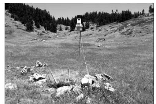
Ο μετεωρολογικός σταθμός της Κεχωρτής

Ένα ιδιότυπο γεωλογικό φαινόμενο έχει διαμορφωθεί στις ψηλές κορυφές του Βυτινιώτικου Μαινάλου πλησίον της «Αλογόβρυσος» και κάτω από την «Πατερίτσα». Η ευρύτερη περιοχή είναι γνωστή με το τοπωνύμιο «Κεχωρτή», ενώ στο κέντρο της είναι το «Βρωμοπήγαδο». Η περιοχή αυτή είναι γνωστή στους Βυτιναίους, που ανεβαίνουν το καλοκαίρι μέχρι εκεί να μαζέψουν τσάι, ενώ την προηγούμενη πεντηκονταετία Βυτιναίοι βοσκοί ανεβάζαν στην περιοχή τα κοπάδια τους. Βέβαια προ εκατονταετίας, όσο και αν ακούγεται παράξενο, οι Βυτιναίοι καλλιεργούσαν κάποιες από αυτές τις εκτάσεις όπως τις «Πενταζέικες λάκκες». Το γεωλογικό φαινόμενο που διαμορφώνεται στην περιοχή ονομάζεται «δολίνη». Οι «δολίνες» είναι φυσικοί σχηματισμοί που δημιουργούνται σε ορεινές περιοχές λόγω καταβύθισης του εδάφους και έχουν το χαρακτηριστικό ότι περικλείονται από υψηλότερες ράχες, οι οποίες τις απομονώνουν από την ατμοσφαιρική κυκλοφορία και τις προστατεύουν από τους ανέμους.