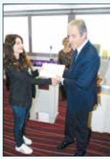
Η απόδοση του βραβείου «Ευθυμίου Χριστοπούλου»