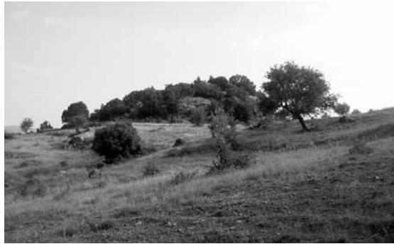
Τα Βεδούκια και η «Μαύρη Πέτρα». Από τα πιο παλιά αμπελοτόπια που «αποψηλώθηκαν» γρήγορα.