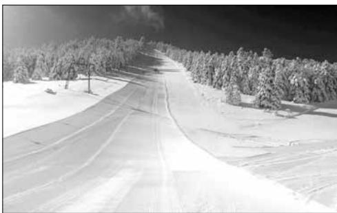
Εικόνα του χιονοδρομικού τις ημέρες των μεγάλων χιονοπτώσεων

Ο φετινός Γενάρης με τις συχνές και έντονες χιονοπτώσεις βοήθησε αρκετά τη λειτουργία του, παρόλο που μέχρι τις γιορτές των Χριστουγέννων ελάχιστα είχαν ασπρίσει οι κορυφές της Οστρακίνας. Το μόνο αρνητικό για τη Βυτίνα είναι ότι παραμένει για μεγάλα διαστήματα κλειστός ο δρόμος, που οδηγεί σε αυτό ιδιαίτερα την περίοδο των μεγάλων χιονοπτώσεων κάτι που συνέβη και φέτος με αποτέλεσμα πολλοί διαμένοντες