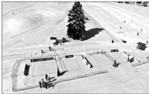
Τα γήπεδα βολλεϋ

Το σπουδαιότερο φετινό γεγονός πανελληνίας εμβέλειας, που προσήλκυσε πολλούς θεατές και αθλητές ήταν η διοργάνωση