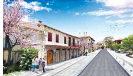
Αναπαράσταση του τμήματος εξόδου του κεντρικού δρόμου