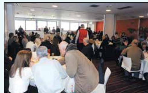
Η αίθουσα της εκδήλωσης