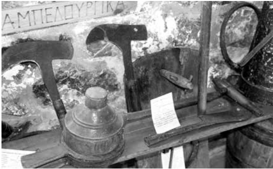
Κλαδευτήρια (Λαογραφικό μουσείο Βυτίνας)