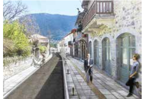
Ο δρόμος της εισόδου

Η Βυτίνα, αν θέλει να έχει τουριστικό μέλλον και να ανταγωνίζεται «επί ίσους όρους» τους ανταγωνιστές της, πρέπει να διευκολύνει τον επισκέπτη, να του δίνει την ευκαιρία να κυκλοφορεί άνετα, να γνωρίζει τα αξιοθέατα και να κάνει τις προμήθειές του από τα τοπικά καταστήματα χωρίς δυσκολίες. Ο σεβασμός προς τον επισκέπτη φαίνεται από τη νοικοκυρεμένη και την προσεγμένη όψη των δρόμων και των λοιπών κοινόχρηστων χώρων. Σήμερα ο επισκέπτης έχοντας μεγά-