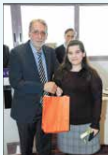
Η βράβευση των Βυτιναιών φοιτητών