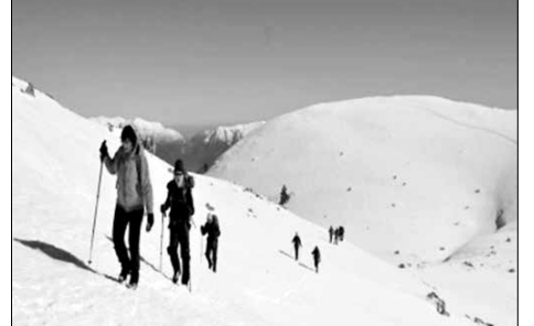
Η πορεία του ΣΑΟΟ στο χιονισμένο Μαίναλο

το βουνό της Βυτινίας, μας κάνει ιδιαίτερα ευαίσθητους. Στο χιονισμένο Μαίναλο, λοιπόν, πραγματοποίησε πορεία ο ΣΑΟΟ την Κυριακή 17-2 εκμεταλλευόμενος τον ηλιόλουστο καιρό και προσφέροντας στα μέλη του μια μοναδική εμπειρία. Ξεκίνησαν από τον χώρο στάθμευσης του χιονοδρομικού και περπατώντας πάνω στο παγωμένο χιόνι έφτασαν στην κορυφή της Οστρακίνας. Από εκεί πέρασαν από τη «Βουρβούλα», όπου επίσης το χιόνι ήταν παγωμένο. Κατέβηκαν στο «Μέγα Διάσελο», όπου και το Βυτινιώτικο όριο. Το χιόνι εκεί βούλιαζε «μέχρι το γόνατο», κατά την περιγραφή τους, και