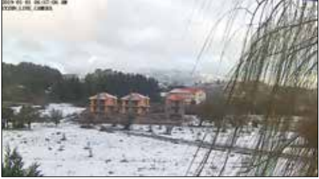
Η Βυτίνα το πρωί της Πρωτοχρονιάς

1 Ιανουαρίου 2019: Αρχή νέου έτους. Επίσημη δοξολογία έγινε στον Ι.Ν. του Αγίου Τρύφωνα, για να «ευλογηθεί» η είσοδος του καινούργιου χρόνου. Κάλανα την παραμονή με χιονόπτωση που άρχισε από νωρίς πριν το μεσημέρι και έδωσε ένα υπέροχο «χρώμα» στο χιονισμένο χωριό, που