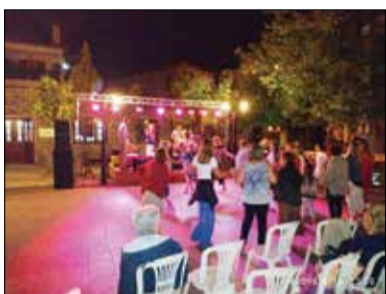
Από το φεστιβάλ Μαινάλου.

Αλλά και όσοι έμειναν μεγάλο διάστημα να συνειδητοποιήσουν τα προσόντα του χαρισματικού αυτού