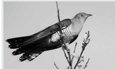
ΓΡΑΦΕΙ: Ο «Νοσταλγός»

Αν κάποιος περιδιαβεί τη Βυτινιώτικη ύπαιθρο τους καλοκαιρινούς μήνες δύο ήχοι θα νιώσει έντονα.