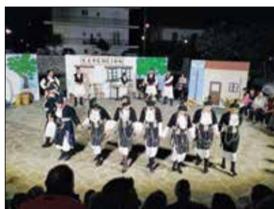
Από τη γιορτή του Πολιτιστικού συλλόγου.

Ο Ιούλιος περισσότερο «κινητικός». Εμφανίστηκαν