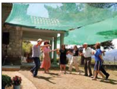
Από το πανηγύρι του συνδέσμου φιλοπροόδων στην Αγία Παρασκευή.

κάποιοι Βυτιναίοι που θα περνούσαν το καλοκαίρι κοντά μας. Στις αρχές του μήνα οι εθνικές εκλογές δημιούργησαν αρκετή κίνηση από τους Βυτιναίους ψηφοφόρους, που ήρθαν να ψηφίσουν. Δύο σπουδαίες πολιτιστικές εκδηλώσεις πραγματοποιήθηκαν τον μήνα αυτό. Η ετήσια γιορτή του Πολιτιστικού συλλόγου στο μικρό θεατράκι στα «Λαστέικα» και το πανηγύρι της Αγίας Παρασκευής, που οργανώνει κάθε χρόνο ο σύνδεσμος Φιλοπροόδων. Οι ντόπιοι αλλά και οι παρειδημόντες συμμετείχαν και χάρηκαν τις δύο αυτές γιορτές. Το πανηγύρι του Αϊ Λιως πραγματοποιήθηκε και φέτος μόνο όμως κατά το θρησκευτικό του μέρος. Περισσότερος κόσμος και κίνηση τον μήνα αυτό, τον «Αλωνάρη» της παράδοσης.