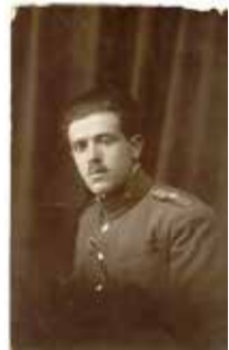
Ο ήρωας ταγματάρχης Μνημείο Αγνώστου Στρατιώτη Δ. Κασλός.

Μετά θάνατον τού αποδόθηκε ο βαθμός του ταξίαρχου. Μέχρι το τέλος της ζωής ένιωθε πικρία για την αντιμετώπισή του αυτή. Αλλά δυστυχώς αυτή είναι η τύχη των πρώων. Όπως ο Μιλτιάδης και ο Θεμιστοκλής μετά το Μαραθώνα και τη Σαλαμίνα εξορίστηκαν από την πατρίδα τους θύματα φανατισμού και μισαλλοδοξίας, έτσι και ο Κασλός δοκίμασε την εξορία αντί της τιμής. Σήμερα όμως ο ηρωισμός του αναγνωρίζεται και το ανυπέβλητο κατόρθωμα στο ύψωμα 731 προβάλλεται ως δείγμα πίστης στην πατρίδα και υπεράσπισης των αιωνίων ιδεών του Ελληνισμού.