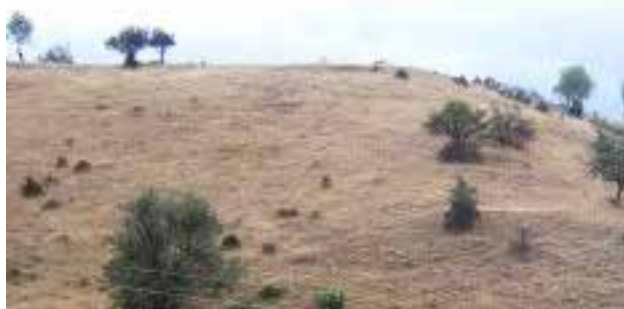
Το παλιό αμπελοτόπι στα «Λακκώματα» όπως είναι σήμερα

« Τον «Τρυγητή» φτιάξε κρασί και τον «Ζευγά» σιτάρι. » Και όλα αυτά, για να μην ξεχνάμε τις ρίζες μας.