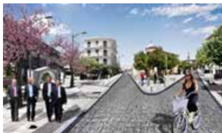
«Μακέτα» της ανάπλασης του κέντρου της κωμόπολης.

Προτελευταίο Σαββατοκύριακο του Σεπτεμβρίου: Μπαίνουμε στην τελευταία βδομάδα του «τρυγητή» και φθινόπωρο με την πραγματική του έννοια δεν είδαμε ακόμη. Κάποιοι τελευταίοι επισκέπτες του καλοκαιριού, φανατικοί Βυτινίοι, μένουν ακόμα κοντά μας. Οι θερμοκρασίες είναι υψηλές για την εποχή, ενώ οι ρυθμοί της καθημερινότητας είναι τελείως χαλαροί. Η κίνηση υποτονική και μόνο το μεσημεριανό σχολάσμα των σχολείων δίνει κάποια ζωντάνια στο κέντρο της κωμόπολης. Οι κλειστές καφετέριες της πλατείας κάνουν ακόμη πιο έντονη τη φθινοπωρινή απραγία. Για να μην νομίζουμε ότι ζούμε μακριά από τα φαινόμενα των μεγαλουπόλεων με τις ληστείες και τις βιαιότητες, πρόσφατα συνέβη και εδώ μια ληστεία, όταν διέρρηξαν το σπίτι υπερήλικης συμπολίτιδός μας και αφήρεσαν σεβαστό ποσό. Όλα αυτά είναι αποτελέσματα ελλειπούς αστυνόμευσης και έτσι ο υπερήλικας κάτοικος της Γορτυνίας στα απομακρυσμένα χωριά νιώθει τελείως απροστάτευτος. Ελπίζουμε ότι η νέα δημοτική αρχή θα βρει κάποια λύση του προβλήματος.