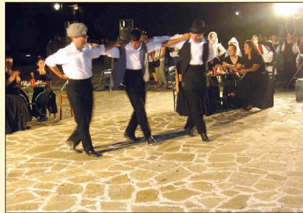
Το πολιτιστικό «δρώμενο» στο τέλος της εκδήλωσης

Η τελειότητα της απόδοσης από μικρούς και μεγάλους χορευτές έδειξε ότι το έργο το οποίο πραγματοποιείται τόσο από τη διδάσκουσα κ. Χριστίνα Ζαμπαθά όσο και από τους μαθητές είναι αξιόλογο και πολύ αποδοτικό. Τέλος το τελευταίο «δρώμενο» από τους ενήλι-