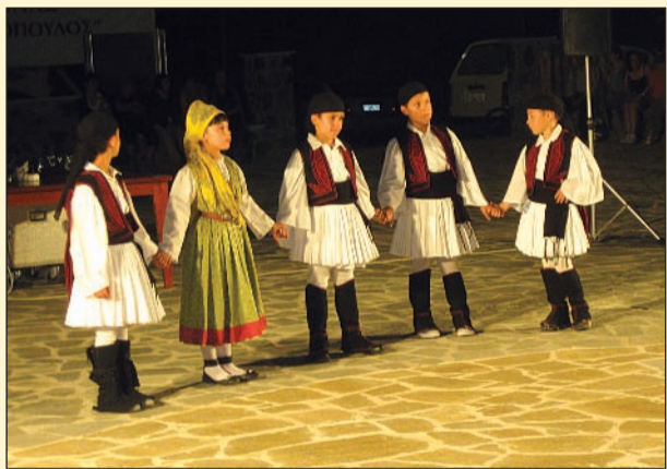
Οι πιο μικροί χορευτές αποδίδουν Μωραϊτικούς σκοπούς