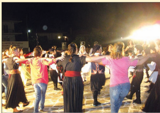
Το τέλος της εκδήλωσης βρήκε χορευτές και θεατές μαζί