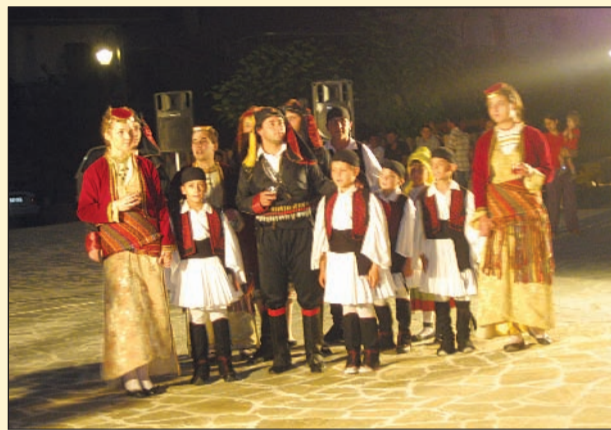
Η είσοδος όλων των χορευτών στο χώρο της παράστασης

Η Βυτίνα θεωρείται από τα πλέον προνομιούχα μέρη, διότι έχει τη δυνατότητα να διατηρεί σε δράση με σημαντική προσφορά στα τοπικά «δρώμενα» δύο συλλόγους όπως ο «σύνδεσμος Φιλοπροόδων» και ο πολιτιστικός σύλλογος «Κων/νος Παπαρρηγόπουλος». Για τη δράση και την προσφορά του συνδέσμου φιλοπροόδων ασχοληθήκαμε σε παλαιότερα δημοσιεύματα. Στο σημείο αυτό θα παρουσιάσουμε την πολύμορφη και πολύτιμη πολιτιστική δραστηριότητα του συλλόγου «Κων/νος Παπαρρηγόπουλος».