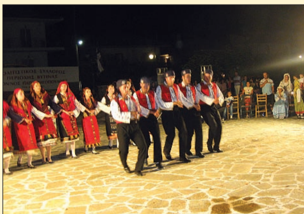
Ποντιακοί χοροί από τους μεγάλους

Ο πολιτιστικός σύλλογος άρχισε να λειτουργεί επίσημα μετά την