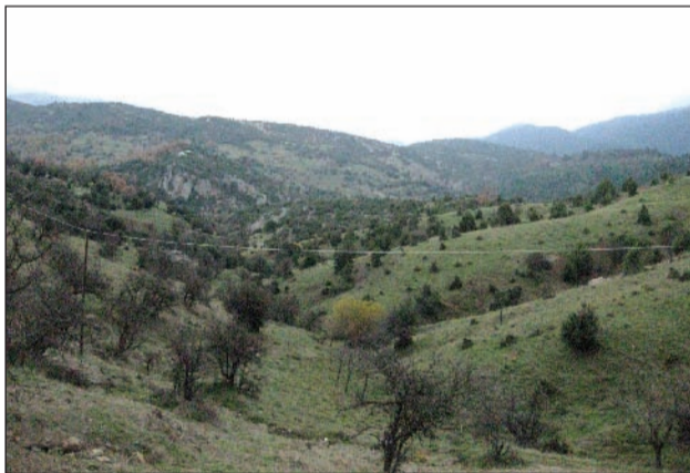
Το «Ζαρζί» πανοραμικά από την «Κάτω Βυτίνα»

Το κυνήγι για το Βυτιναίο κυνηγό τόσο προπολεμικά, όσο και τα πρώτα μεταπολεμικά χρόνια ήταν πολύ δύσκολο, διότι έπρεπε να διανύει μεγάλες αποστάσεις με τα πόδια, τα όπλα του ήταν αρκετά «πρωτόγονα» σε σχέση με τα σημερινά και το αποτέλεσμα επομένως ανάλογο, κάτι που το έδειχνε και ο μικρός αριθμός θηραμάτων, που έμπαιναν στο Βυτινιώτικο σπίτι. Εάν ο αριθμός αυτός ήταν φτωχός, ο κυνηγός όμως είχε την ευκαιρία να απολαύσει το μεγαλείο της φύσης, που το δοκίμαζε μεν ως γεωργός ή ως ξυλοκόπος ακόμα και ως βοσκός, αλλά δεν είχε την ευκαιρία να διανύει τόσο μεγάλες αποστάσεις και να βλέπει τόσο μεγάλες εκτάσεις ακόμα και χιονισμένες περιοχές όπως με το κυνήγι.