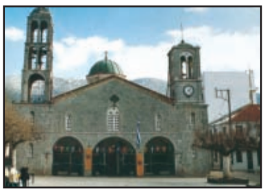
Κωδικός 01- 4170