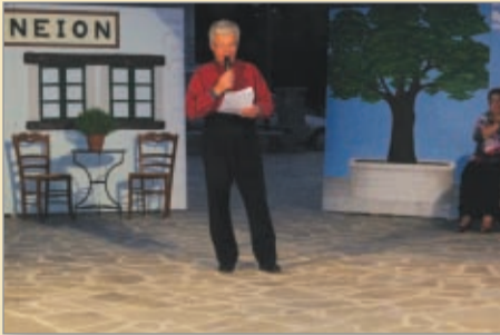
Ο χαιρετισμός του προέδρου

Όπως γίνεται τα τελευταία χρόνια, ο πολιτιστικός σύλλογος της Βυτίνας μέσα στο μήνα Αύγουστο πραγματοποιεί την ετήσια εκδήλωσή του κατά την οποία παρουσιάζει στο τοπικό κοινό το σύνολο του έργου που πραγματοποιείται στα δύο τμήματά του δηλ. το χορευτικό και το μουσικό.