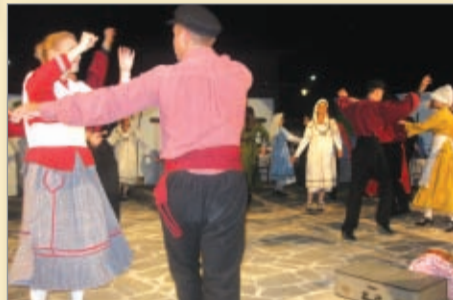
Η επιστροφή του ξενιτεμένου

Και τώρα στο μουσικοθεατρικό δρώμενο, που διήρκεσε 2.30 ώρες και κράτησε καθηλωμένους τους πολυπληθείς θεατές, οι οποίοι γέμισαν τα καθίσματα του θεάτρου και πάνω από εκατό παρακολούθησαν όρθιοι την εκδήλωση. Το περιεχόμενο του θεατρικού δρώμενου, όπως αναφέρθηκε και πιο πάνω, ήταν ο